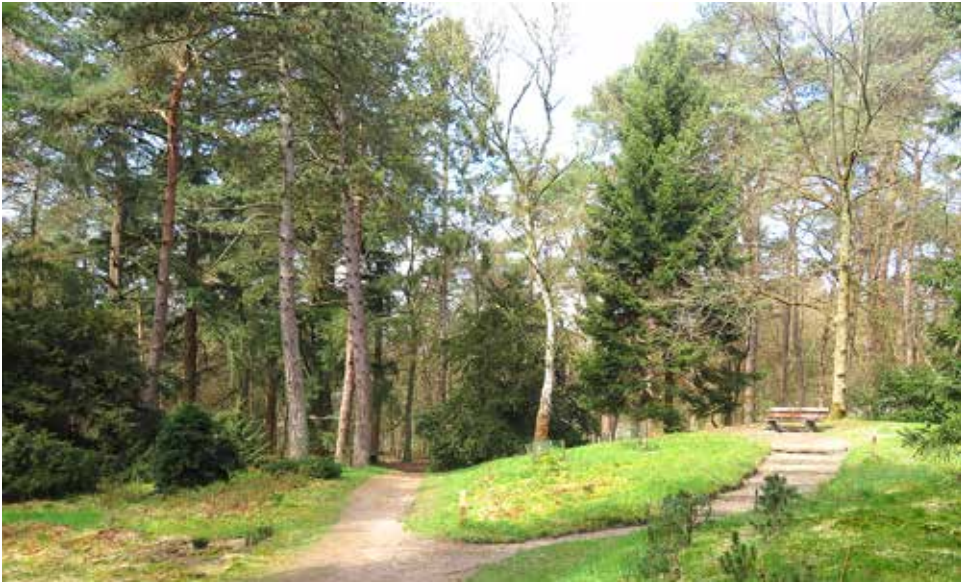
Overzicht bij het bankje op de heuvel

Maar de geschiedenis van het pinetum gaat veel verder terug dan 1982.