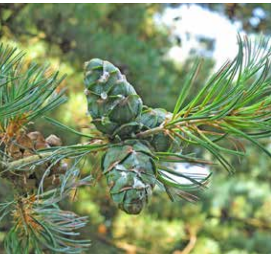
Kegels van Pinus parviflora

In het Zuid-Europese deel vallen drie Atlasceders ( Cedrus atlantica ) en twee Abies pinsapo op. Ook de Wierookceders ( Calocedrus decurrens ) staan nog steeds met z'n drieën bij elkaar en zijn de moeite om even bij stil te staan.