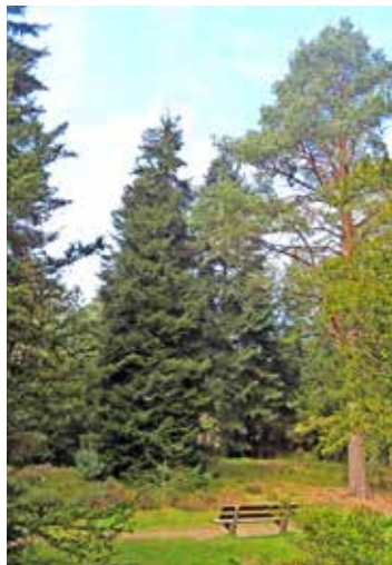
Picea orientalis met rechts ervan Pinus sylvestris