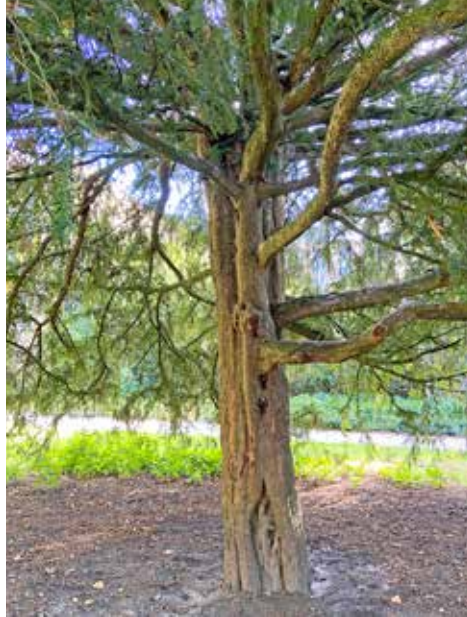
De stam in oktober 2022