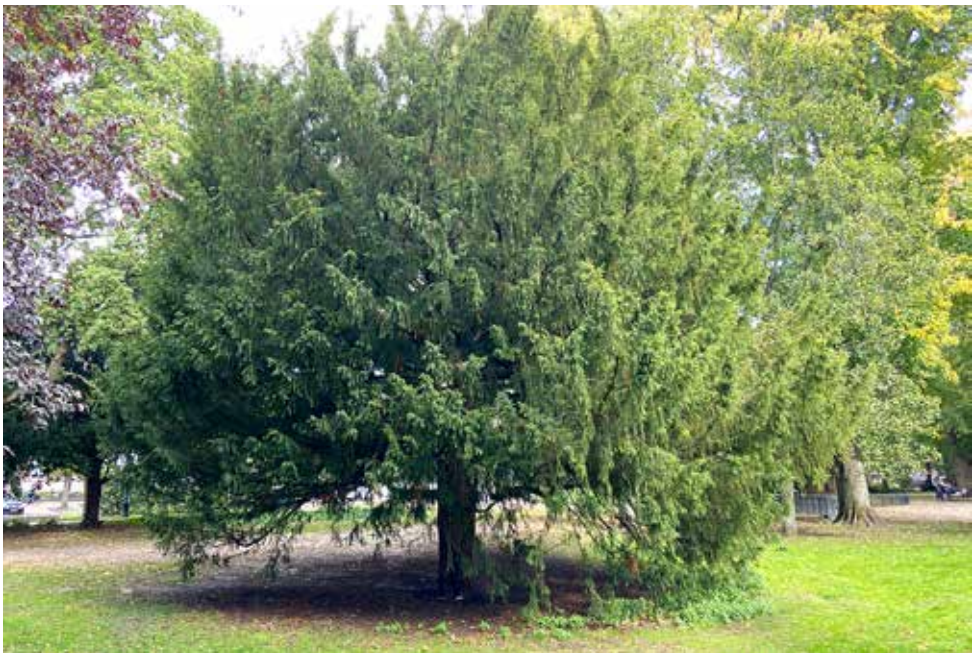
Herfstbeeld in oktober 2022

Deze Venijnboom, een mannelijk exemplaar, ken ik al jaren, maar hij viel mij niet bijzonder op totdat ik deze ging opmeten voor het vrijwilligersinitiatief OpenBomenKaart.org en ik wilde weten hoe oud deze boom zou kunnen zijn.