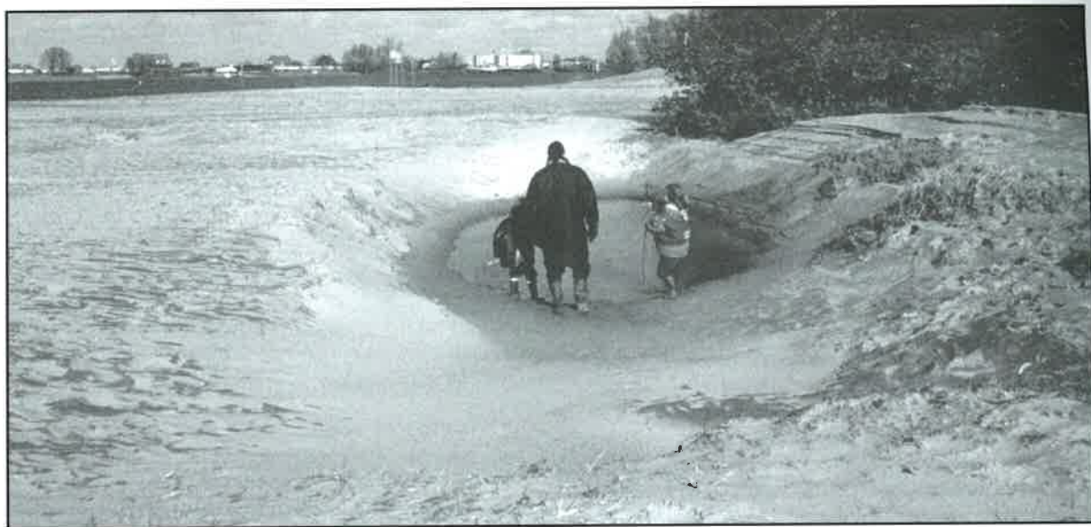
Op het Millingerduin zijn diepe kolken uitgesleten