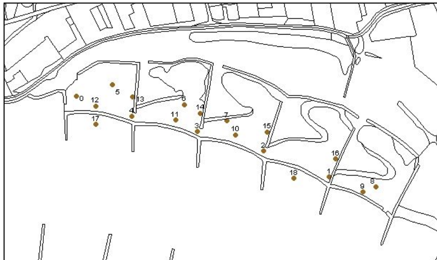
Figuur 1. Ligging van de monsterpunten

In figuur 1 staan de locaties aangegeven waar in het voorjaar van 2002 een bemonstering is uitgevoerd. In tabel 1 staan de gegevens over de genomen monsters.