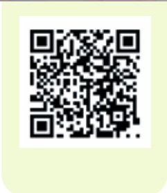
Figuur 2 32 voorbeelden van bouwen aan de symbiotische stad. De brochure 'De symbiotische stad' met daarin deze afbeelding is op www.wur.nl/nl/show/brochure-symbiotische-stad.htm te vinden of door bijgaande QR-code te scannen.