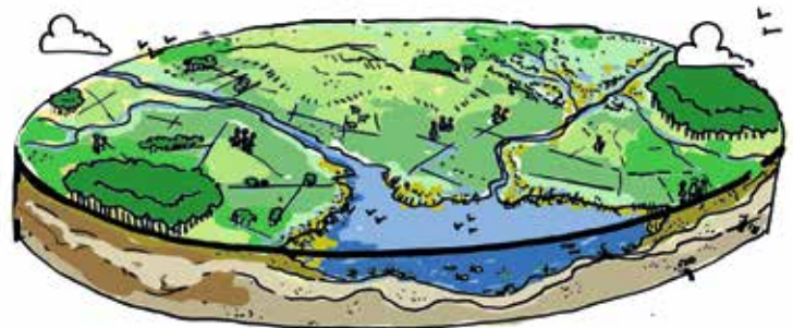
Figuur 1 De drie lagen van de symbiotische stad.

stad waarin de samenhang tussen mensen en natuur vanzelfsprekend is.