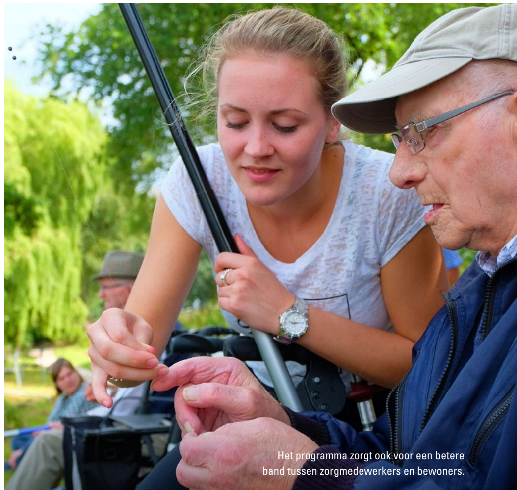
Het programma zorgt ook voor een betere band tussen zorgmedewerkers en bewoners.

Aan de waterkant genieten van de natuur, een praatje maken en tegelijkertijd in spanning afwachten wanneer de dobber ondergaat: voor veel bewoners van zorgcentra is dit niet meer vanzelfsprekend. Daarom organiseren vrijwilligers van hengelsportverenigingen binnen het programma Samen VISSen visuitjes voor bewoners van zorgcentra. Recent is de effectiviteit van dit programma onderzocht.