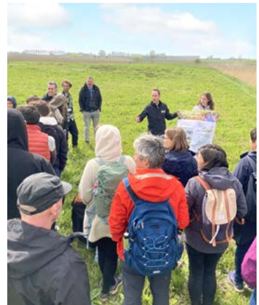
Uitwisseling tussen landbouwers, beleidsmakers en onderzoekers in het Partridge-demogebied in Boekhoute.