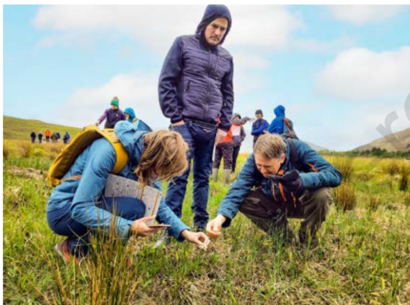
Kennismaking met Iers vergoedingssysteem op basis van scorekaarten.

Landbouwers zijn onlosmakelijk verbonden met de natuur. Ze zijn niet alleen producenten van voedsel, maar ook hoeders van het landschap en de biodiversiteit in het landbouwgebied. Om die maatschappelijke rol te kunnen vervullen hebben boeren echter wel steun nodig. Beheerovereenkomsten, ecoregelingen en niet-productieve investeringen komen hieraan tegemoet en vergoeden boeren voor het nemen van maatregelen die bijdragen aan de natuur en het milieu. Het Europese Horizon 2020-project Contracts2.0 onderzocht hoe deze contracten meer resultaat kunnen opleveren en beter inspelen op de wensen en noden van landbouwers.