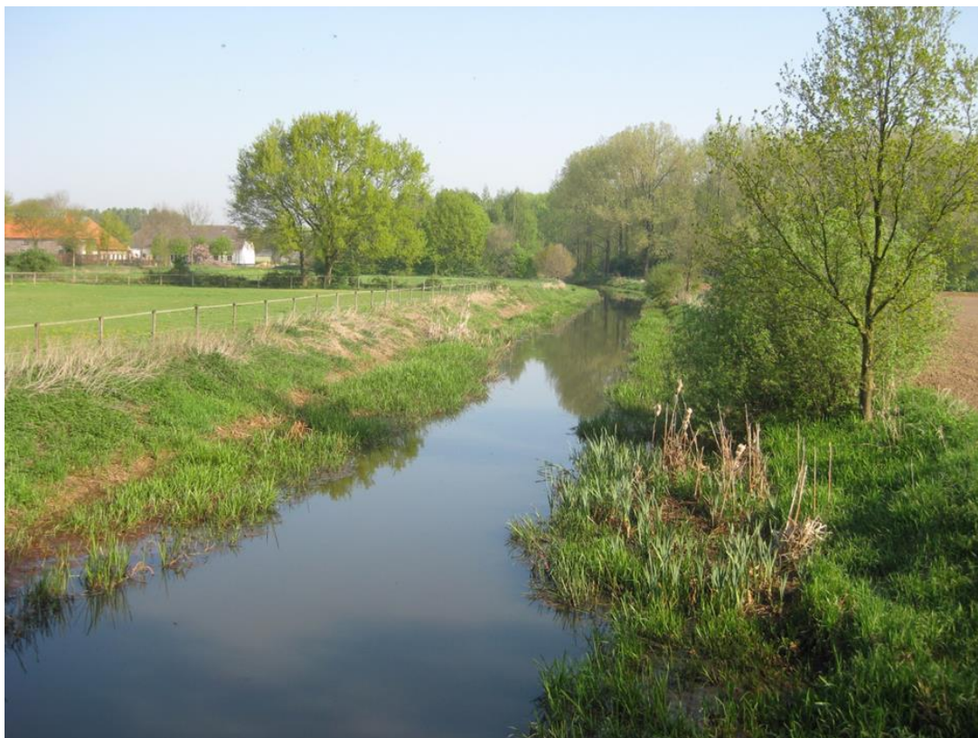
Afbeelding 4. Verlanding binnen het profiel van de waterloop