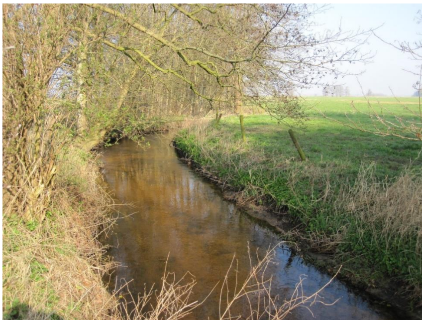
Afbeelding 2. Goed ontwikkelde houtwal met voldoende beschaduwing voor de beek