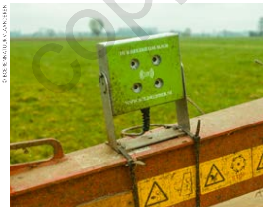
Akoestische wildredder in werking op de maaibalk.

Vluchtstroken zijn ongemaaid stukken grasland die niet gemaaid worden zodat het dieren de mogelijkheid biedt om er te schuilen. De breedte van de vluchtstrook is hierbij belangrijk. Aangeraden wordt om een rand of strook van minstens 5 meter breed te voorzien om de kans op predatie zo laag mogelijk te houden. Een alternatief zijn