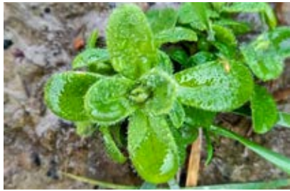
Akkerhoornbloem, duidelijk te herkennen aan de behaarde blaadjes met middennerf.