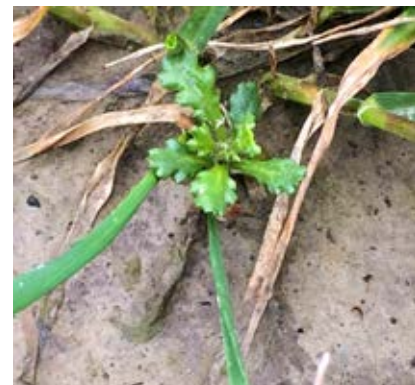
Klein kruiskruid wordt op vele percelen in het binnenland een belangrijke speler. Na een correctie kan dit onkruidje zich toch nog verder uitzaaien.