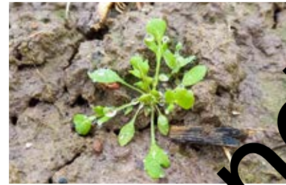
In de regio Vlaams-Brabant is er veel klaproos aanwezig. De blaadjes zijn verspreid behaard.