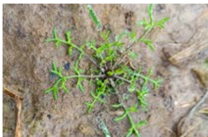
Kamille is al op veel plaatsen in verschillende stadia aanwezig.