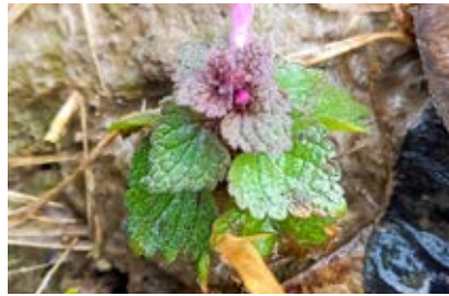
Aan de randen van enkele percelen kunnen we ook al paarse dovenetel vinden.