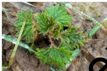
Ook de ontwikkeling van kleine brandnetel is volop bezig.