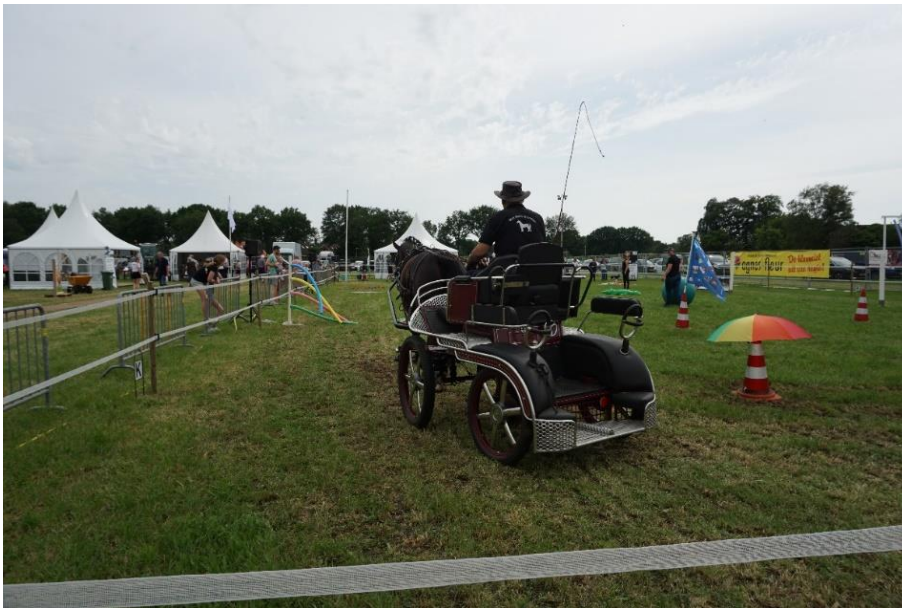
Afbeelding 2 Menssportdemonstratie.

in de buurt van Vlagtwedde minder is dan wordt aangenomen. Zijn taak was om zo veel mogelijk boeren te overtuigen om mee te doen. Het stikstofbeleid is ook een belangrijk onderwerp bij de bezoekers om mij heen. Menigmaal hoor ik mensen hun misnoegen daarover uitspreken. "Die boeren verhuizen gewoon naar een andere plek waar het wel kan, je verplaatst het probleem hiermee alleen maar." "Die Van der Wal, die doet maar wat." "Wat een onzin."