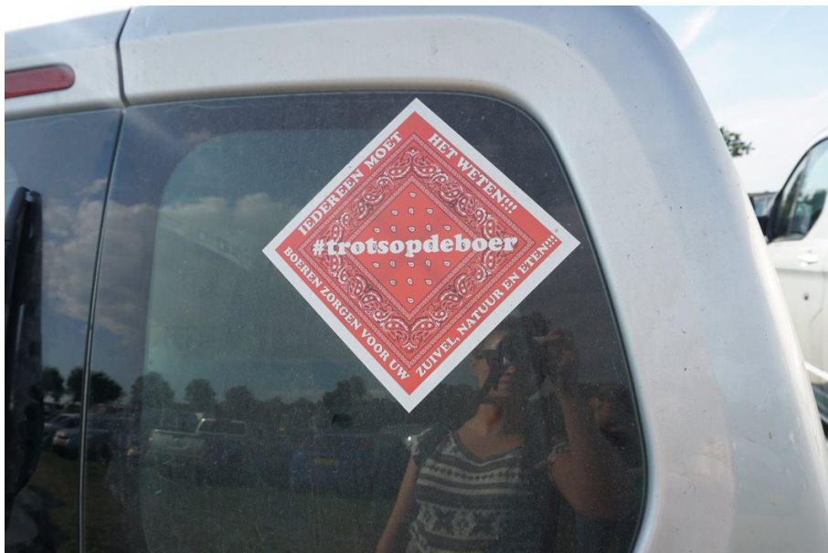
Afbeelding 5 Auto met #trotsopdeboer.

Aangekomen bij de beurslocatie worden we vriendelijk onthaald door een verkeersregelaar in een geel hesje. We worden een grasland opgestuurd om te parkeren. Het grasland bestaat uit Engels raaigras. Ongeveer aan één op de tien auto's die geparkeerd staan, is een rode zakdoek geknoopt. Zakdoeken zijn vaak aan de trekhaak- of achter de ruitenwisser bevestigd. Een enkeling had een sticker in de vorm van een zakdoek op zijn auto bevestigd met de tekst: #trotsopdeboer.