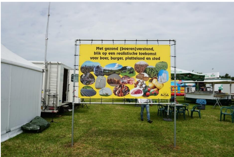
Afbeelding 1 Spandoek bij de ingang.