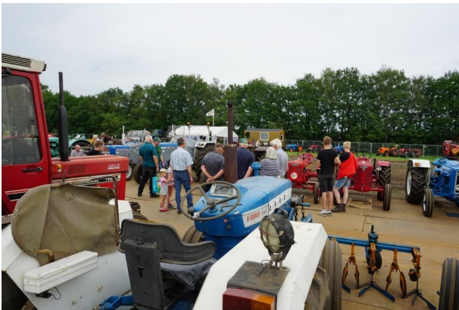
Afbeelding 3 Een groep bezoekers bekijkt oude trekkers en werktuigen (foto door auteur gemaakt).

Ik word op een gegeven moment aangesproken door iemand van een agrarische jongerenvereniging. Ik word door hen gevraagd of ik wil komen raden hoeveel een hooibaal weegt. De jonge man, begin 20, die mijn schatting opschrijft, moet lachen. Ik krijg de indruk dat ik het gewicht van de hooibaal zwaar heb overschat. Als ze vragen wat ik doe, vertel ik dat ik onderzoeker ben en onderzoek doe naar landbouwinnovatie. Net als bij de anderen aan wie ik dit vertel, blijkt het een doodoener te zijn voor de sfeer. Het gesprek valt stil totdat een van de jongeren mij vraagt of ik misschien nog een baan voor hem weet, iets in de backoffice