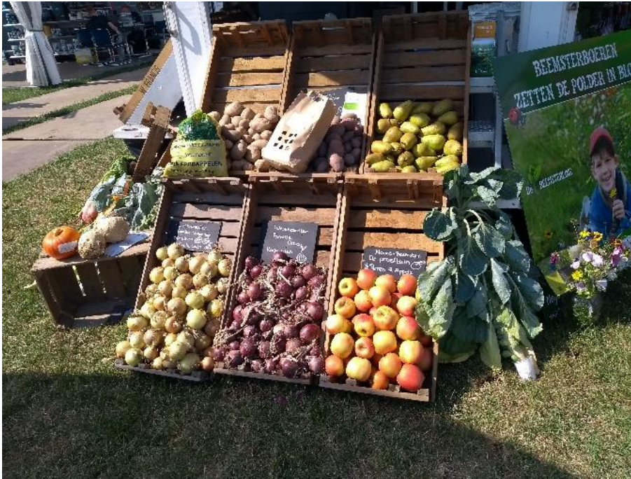
Afbeelding 9 Stand met streekproducten.

De volgende stand liet een grote foto zien van een plas-dras vogelland en had een uitstalling van een pomp voor plasdras, zonnepanelen voor de pomp en schrikdraad tegen vossen. De standhouder begon terughoudend nadat we vertelden dat we onderzoekers zijn, maar werd tijdens het gesprek opener. Meneer noemde dat het erom gaat dat het schrikdraad écht goed geplaatst moet worden, aangezien vrijwilligers het nog weleens fout geplaatst hebben (waardoor het nog steeds geen zin had tegen de vos). Meneer noemde dat er voor de wolf hogere palen nodig zijn, maar die zijn er nog niet echt.