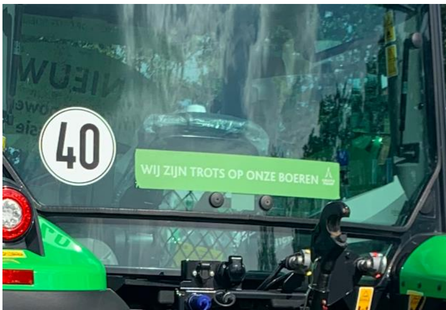
Afbeelding 10 Steunbetuiging voor de boeren.

Voordat we teruglopen naar het agrotechniekgedeelte, lopen we langs een plek waar later in de week het NK hout carven wordt gehouden. We vinden het allemaal jammer dat we dit niet even kunnen zien. Terug op het agrotechniekgedeelte komen we langs de grootste paviljoens. Deze zijn allemaal van de grote trekkermerken. Hier zien we een aantal referenties naar 'Trots op de boer'. Het is erg druk op deze plekken. Dit komt misschien mede doordat er een open bar is en iedereen gratis bier en fris kan halen. Zeker de scholieren maken hier gretig gebruik van.