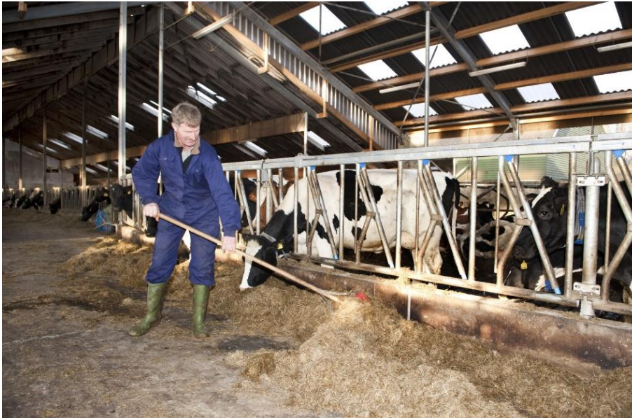
Figuur 5 Voorbeeldfoto behoudend: melkvee voeren met de hand.