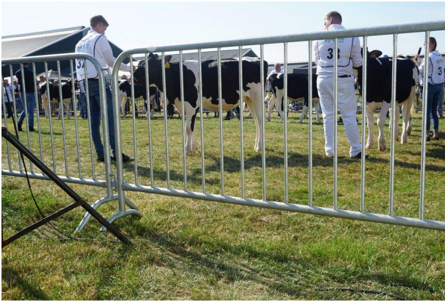
Afbeelding 6 Jongeren presenteren hun jongvee aan de jury.

koeien kregen een rozet op hun halster geklemd en hun eigenaar ontving een beker. Sommige jongeren die meededen, liepen later zelf met een opgespelde rozet over het terrein.