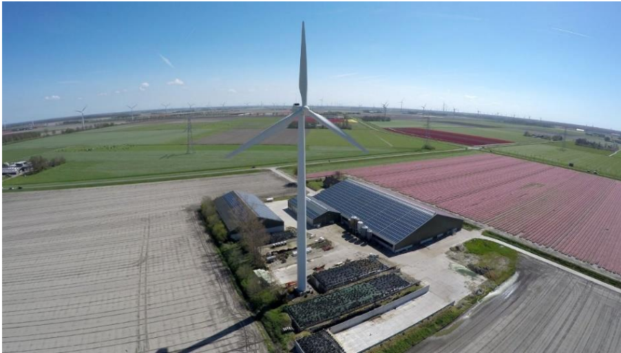
Figuur 8 Voorbeeldfoto klimaat: zelfvoorzienend bedrijf met zonnepanelen en windmolen (bron: Shutterstock).

optimaal afvangen en scheiden van schadelijke stoffen (klimaatmitigatie) en het duurzaam beheren van noodzakelijke grondstoffen (klimaatadaptatie). Veevoerbedrijven ontwikkelen onder andere supplementen die methaanconcentraties uit dierlijke uitwerpselen reduceren en zaadbedrijven breiden hun assortiment uit met optimale CO 2 -afvangende gewassen. Meer in het algemeen wordt het investeren in groene energie als belangrijke kans gezien. Een boer of bedrijf kan daardoor op termijn besparen door zelfvoorzienend te worden of zelfs energie te leveren.