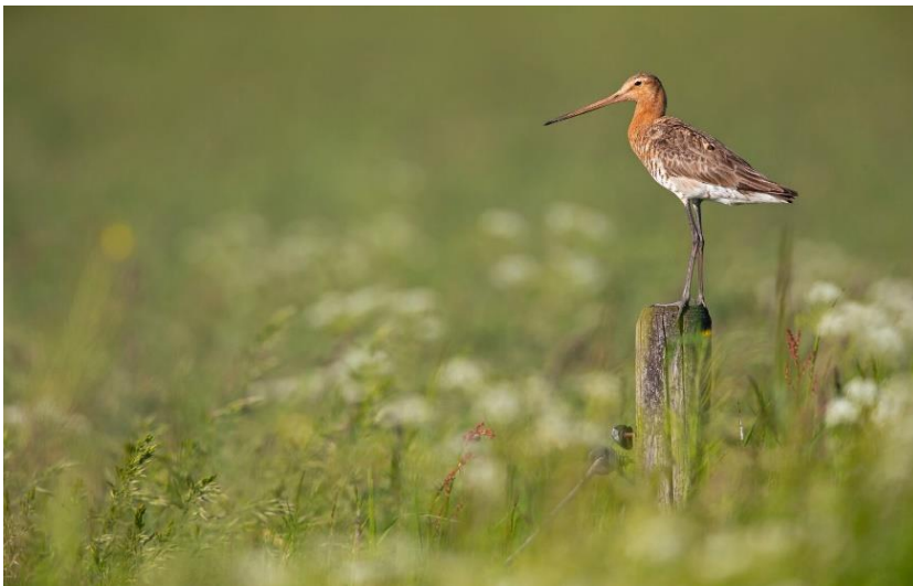
Figuur 6 Voorbeeldfoto biodiversiteit: Grutto in biodivers grasland.

Het discours biodiversiteit draait om landbouw waarbij biodiversiteit wordt gebruikt én bevorderd. Boer en natuur werken samen volgens ketenpartijen en banken die dit discours uitdragen. Er ligt veel nadruk op bodemherstel, het verminderen van chemische bestrijdingsmiddelen, maar ook dierenwelzijn (o.a. langer leven en meer naar buiten) en de kwaliteit van producten zijn belangrijk.