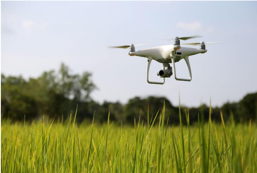
Figuur 1 Voorbeeldfoto hoogproductief en innovatief: een drone om gewassen van boven te monitoren.

Een hoogproductief bedrijf onderscheidt zich aan de hand van hoog rendement en veel arbeidsgemak. Het productiesysteem wordt optimaal gecontroleerd. Digitale en gemechaniseerde stalsystemen zijn in staat het klimaat binnen te beheersen en buiten te beschermen. Alles wordt zorgvuldig gefilterd of gereinigd, zo mogelijk zonder tussenkomst van de boer. In de melkveehouderij is een gezonde koe een koe die veel melk produceert, daarop wordt door fokbedrijven geselecteerd. In de akkerbouw kan de bodemgesteldheid nauwkeurig worden gemonitord en het management aangepast worden op de gewasbehoeften. Ontwikkelingen rondom precisielandbouw bieden de mogelijkheid om te besparen op onnodige input. Loonwerkbedrijven zijn gespecialiseerd om op grote schaal en met hoge snelheid te kunnen oogsten.