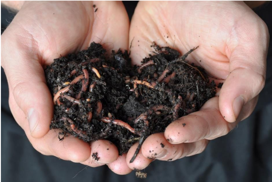
Figuur 7 Voorbeeldfoto biodiversiteit: gezonde bodem met hoge biodiversiteit.

Ketenpartijen erkennen de noodzaak van biodiversiteitsherstel en willen actief bijdragen aan de bewustwording van de impact van landbouwactiviteiten op de biodiversiteit, het landschap en het milieu. Ze faciliteren boeren met (innovatieve) producten en diensten, zoals detectiesystemen en zaaiadvies, en zijn trots op boeren die zich inzetten voor natuur. Ze stimuleren boeren onder andere om bloemrijke akkerranden in te zaaien, met de natuur mee te maaien en weidevogels aan te trekken. Ketenpartijen laten in hun communicatie boeren aan het woord die genieten van hun akkerrand of weidevogels of die leren van de natuur zien als persoonlijke verrijking. Boeren vertellen dat het in eerste instantie spannend was om natuurinclusief te gaan werken; het vraagt lef, ambitie, een andere manier van handelen en werken vanuit een eigen visie. Je moet erin geloven om het tot een succes te maken. Maar ze vertellen ook dat het veel arbeidsplezier oplevert.