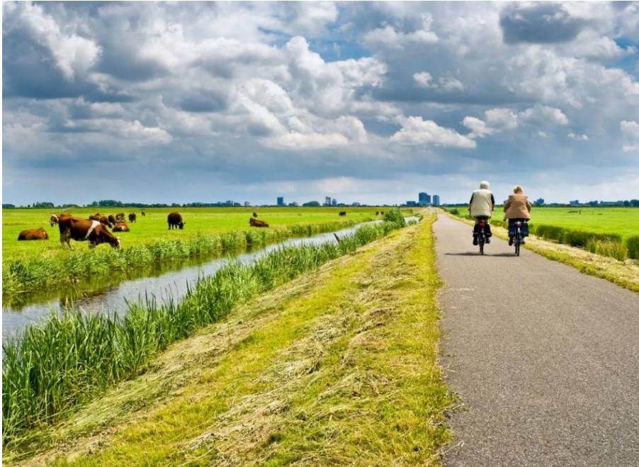
Figuur 2 Voorbeeldfoto maatschappijbewust: recreatie langs een weiland met koeien.

De maatschappelijke druk voor een transitie in de landbouw wordt ervaren als hoog. Ketenpartijen bieden hun diensten aan om de kloof tussen stad en platteland te kunnen overbruggen. Transparantie en vertrouwen spelen daarbij een grote rol. Er wordt gestimuleerd om meer te laten zien hoe voedsel wordt geproduceerd door middel van keurmerken, dialoogvoering, voorlichting en demonstraties. Ketenpartijen voorspellen een groeiende maatschappelijke behoefte aan duurzame en ethisch verantwoorde producten.