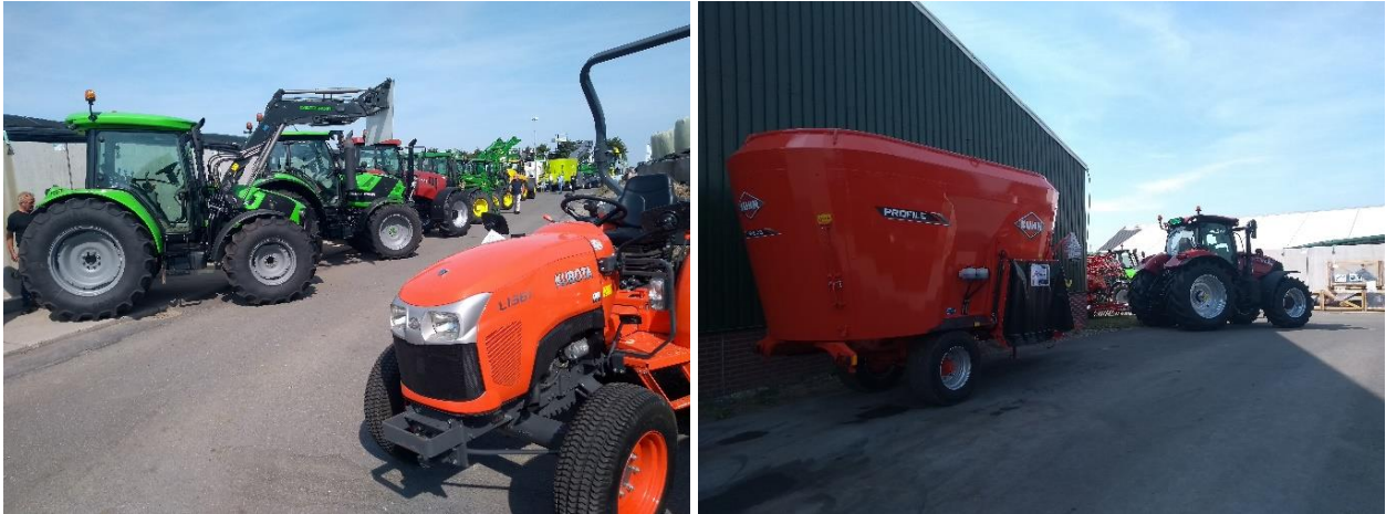
Afbeelding 7 & 8 Trekkers bij de ingang.

Na ons kaartje te hebben laten zien, word je van buitenaf met een 'gang van trekkers' naar binnen geleid. Deze trekkers zijn tweedehands en voor verkoop. Het valt op dat ze erg glimmen en opgepoetst zijn. Ze zien er als nieuw uit en het is gewoon goed spul. We weten niet of er achter de verkoop een bedrijf zit dat tweedehands machines verkoopt. De gang van trekkers trekt bekijks en is de weg naar het 'echte terrein'.