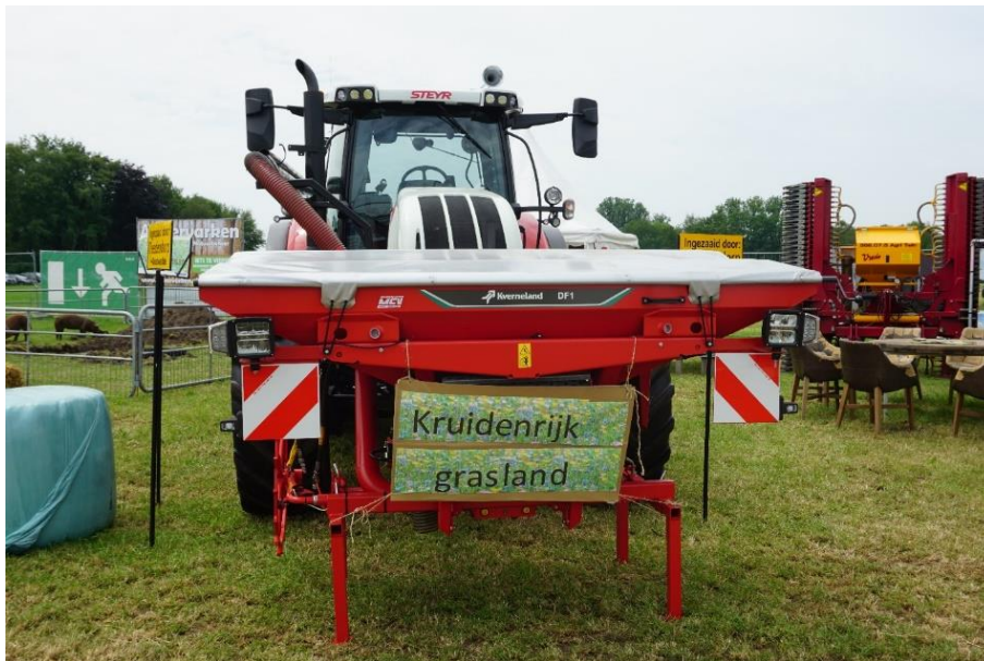
Afbeelding 4 Advertentie voor kruidenrijk grasland.

Mijn uitgebreidste gesprek is met een ondernemer die biologische supplementen verkoopt op basis van zuivelbacteriën. In eerste instantie probeert hij mij te overtuigen van de werking van zijn supplementen. Als ik hem vertel dat ik geen boerin ben maar een onderzoeker, vertelt hij dat hij heeft geprobeerd om Wageningen zijn producten te laten onderzoeken zodat hij een officiële claim op de werking ervan kon krijgen. Het onderzoek zou hem 100.000 euro kosten, en dat vond hij de claim niet waard. Vooralsnog werken zijn producten voor zich en blijft zijn klantenkring daardoor voldoende groeien.