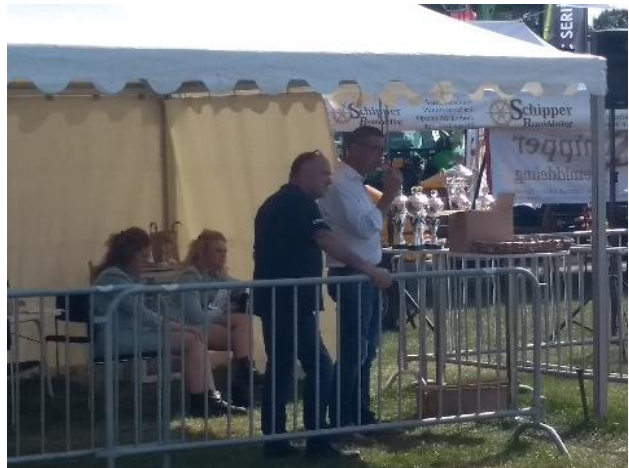
Serie afbeeldingen Jongveekeuring.

De kalfjes die niet meededen aan de show (of al gepresenteerd waren), lagen of stonden in stro onder een afdakje tegen de zon. Er was een soort salon voor de koeien die 'vers gepolijst, gekapt, geschoren en in de lak' werden gezet om ze extra mooi te maken en op te doffen. De koeien werden zelfs na het plassen gedept. Het gaat om 'zien en gezien worden' als professioneel melkveehouder die zijn mooiste koeien showt.