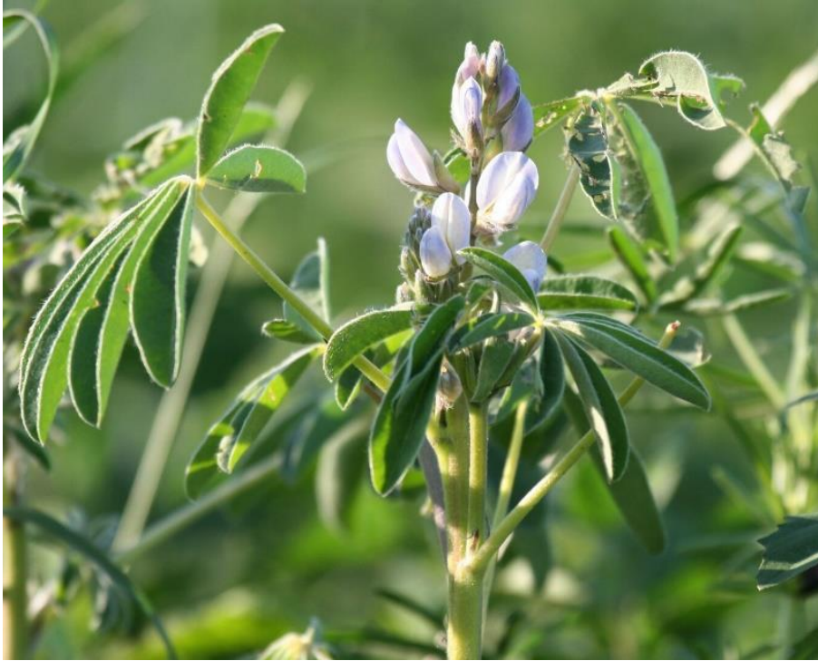
Figuur 3 Voorbeeldfoto kringlooplandbouw: lupine als eiwitrijk gewas in het kader van eiwit van eigen land.

Kringlooplandbouw richt zich sterk op de binnenlandse en lokale markt en draagt daardoor bij aan de opbouw van een circulaire economie. Ketenbedrijven bieden advies aan deze boeren over hoe ze kunnen toewerken naar een kringloopstrategie voor hun bedrijf. Ook bieden ze producten die grondstof- en nutriëntenefficiëntie kunnen bevorderen. Argumentatie richt zich vaak op een te verwachten kostenbesparing (bijvoorbeeld op krachtvoer of kunstmest).