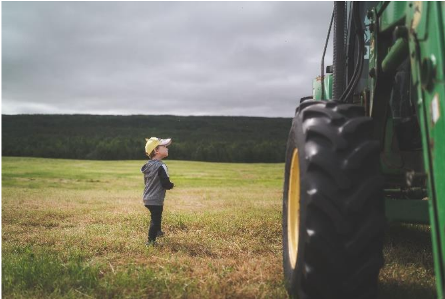
Figuur 4 Voorbeeldfoto behoudend: jong kind bij een tractor benadrukt familiewaarden.

Het behoudende discours stelt zich beschermend op ten aanzien van de landbouw zoals deze nu is. Ketenpartijen portretteren zichzelf en gangbare landbouw als familiebedrijven met decennia aan ervaring. Bedrijven zijn gespecialiseerd en vaak intensief; een constante productie staat symbool voor een goed boerenbedrijf. Het voortzetten van tradities en het behouden van stabiele opbrengsten door te sturen op gezonde planten en dieren is belangrijker dan het boeken van grote winst. Voedselveiligheid en betaalbaarheid zijn de kernwaarden; niet alle biodiversiteit is daarom gewenst. Onkruiden en plaagdieren kunnen bestreden worden om de kwaliteit en continuïteit van de opbrengst te beschermen.