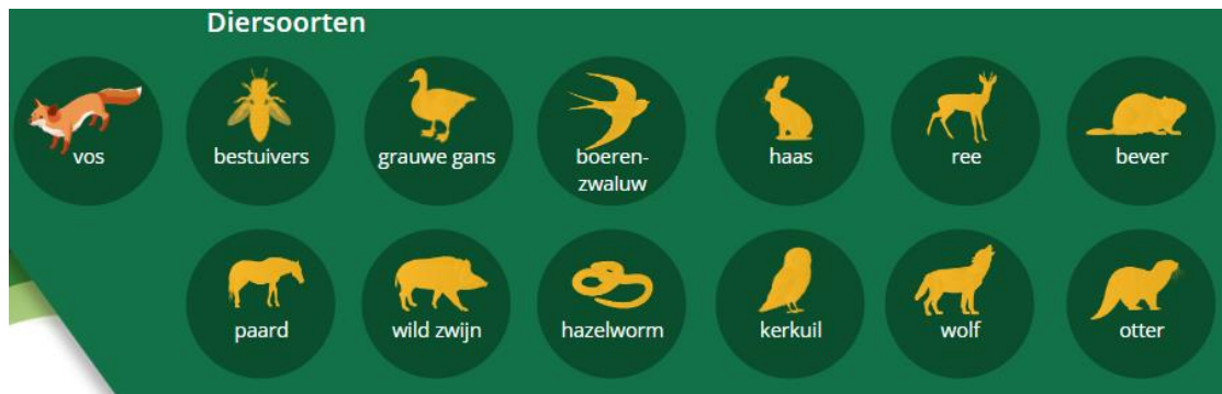
Figuur 1: Faunabeheer in de praktijk (Yuverta en Wageningen University & Research)