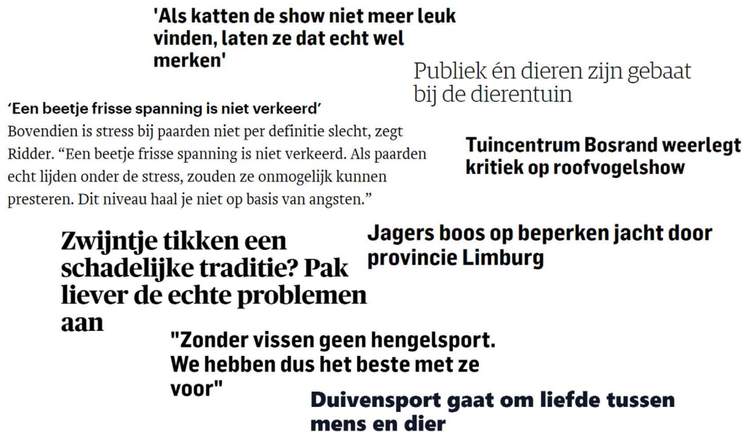
Figuur 2: Een greep uit diverse nieuwsberichten waaruit blijkt dat dierhouders, beoefenaren, organisatoren en andere aanbieders van deze activiteiten de zorgen en kritiek over het gebruik van dieren voor sport, ontspanning, traditie en vermaak niet altijd terecht vinden.

Dierhouders, beoefenaren, organisatoren en andere aanbieders van deze activiteiten vinden de zorgen en kritiek niet altijd terecht, hieronder een greep uit diverse nieuwsberichten 22,10,23,24,25,26,27,28 (zie figuur 2).