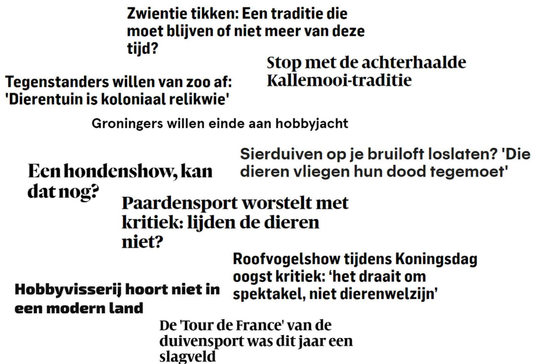
Figuur 1: Een greep uit diverse nieuwsberichten waaruit zorgen en kritiek blijken over het gebruik van dieren voor sport, ontspanning, traditie en vermaak.

In de media zijn geregeld berichten te lezen die de maatschappelijke discussie over de inzet van dieren voor sport, ontspanning, traditie en vermaak weergeven. Figuur 1 geeft een greep uit diverse nieuwsberichten weer 12,13,14,15,16,17,18,19,20,21 waaruit zorgen en kritiek blijken over het gebruik van dieren voor deze activiteiten.