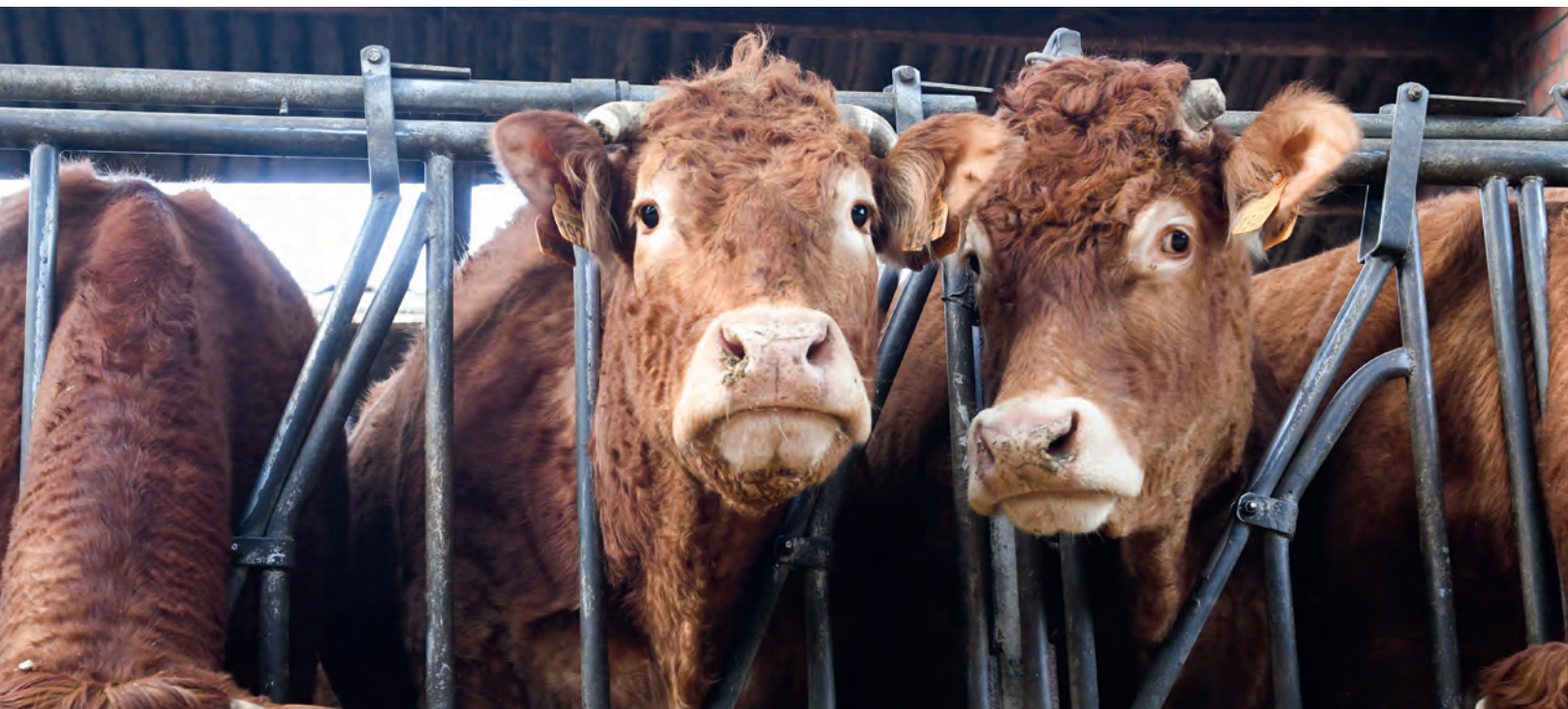
▲ De limousins huizen in een melkveestal