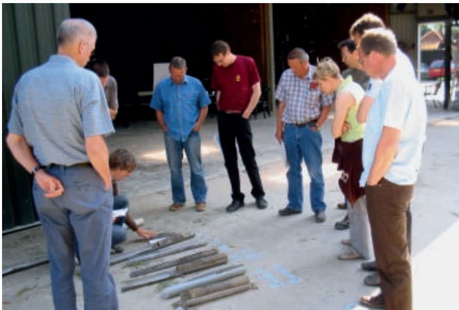
In diverse Best Practices-groepen wordt naar de bodem gekeken. Soms in de vorm van profielkuilen, soms nemen alle deelnemers een PVC-buis met hun eigen bodemprofiel mee.

Meerdere Best Practices-groepen hebben aandacht besteed aan grondbewerking en zaai- en bedbereiding. Vaak werden werktuigen bekeken. In enkele groepen ging men zelfs verder door werktuigen in het veld met elkaar te vergelijken. Dit enthousiasme en de grote inzet illustreren de positieve werkwijze van de Best Practices-groepen.