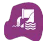
Stedelijk Water & Rioolbeheer

Proceswater en Stedelijk Water & Rioolbeheer. Met deze ontwikkeling blijven we dé watervakbeurs van Nederland.”