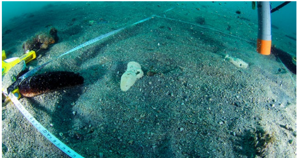
Onderwaterboren (boven) en de vondst van een Romeinse schat (onder).

'Opeens kwamen er kruiken tevoorschijn - een Romeinse schat'