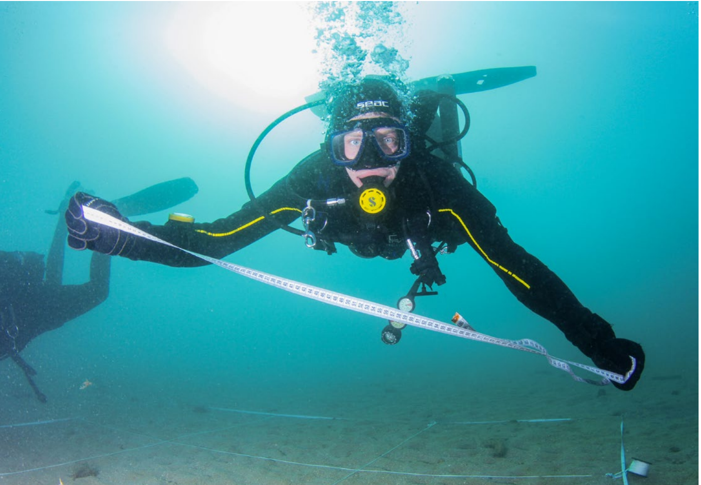
Met een meetlint controleren onderzoekers of het raster op de zeebodem de juiste maat heeft.