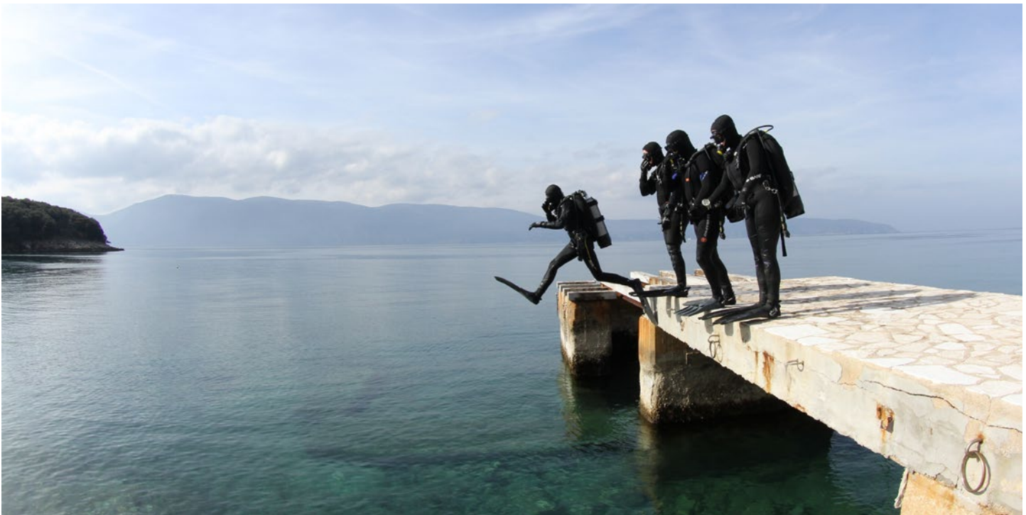
Te water.

In mei en juli wordt de praktijkcursus Scientific Diving voor de tweede en derde keer gegeven. Vanwege de intense begeleiding kunnen er per keer vier studenten meedoen.