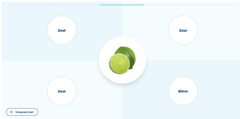
Figuur 1. Voorbeeld digibordmodule