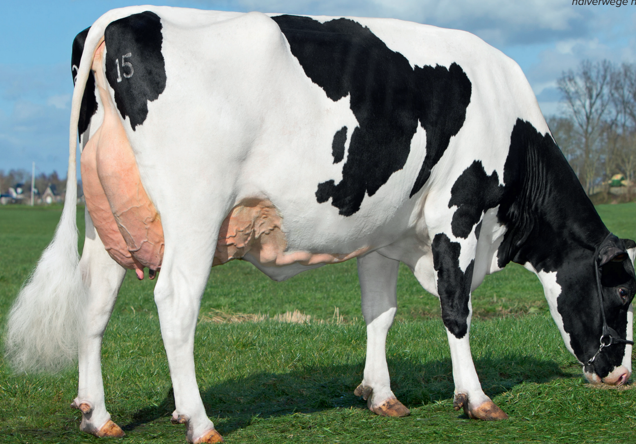
Delta Paulina (v. Malcolm) halverwege haar tweede lactatie