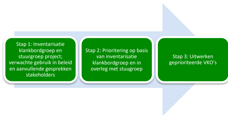
Figuur S.1 Proces om te komen tot prioritering van uit te werken VKO's

Parallel aan het proces om te komen tot een prioritering van uit te werken VKO's is het format voor het opstellen van VKO's uitgewerkt. Per VKO is een unieke uitwerking noodzakelijk omdat de VKO's niet onderling vergelijkbaar zijn. De mogelijkheden voor het opstellen van VKO's worden beschreven in Europese Commissie (2021). Grofweg komt het erop neer dat de methode (1) eerlijk moet zijn; (2) billijk moet zijn en ten slotte (3) controleerbaar moet zijn. Om hieraan te voldoen is gewerkt met het format dat wordt gebruikt binnen het SFC2021-programma (zie bijvoorbeeld ook Programma EFRO 2021-2027 voor het Brussels Hoofdstedelijk Gewest). Het format werkt aan de hand van 19 vragen. Het format is getest op bruikbaarheid door de 2 bestaande VKO's uit te werken en is afgestemd met de Auditdienst Rijk (ADR).