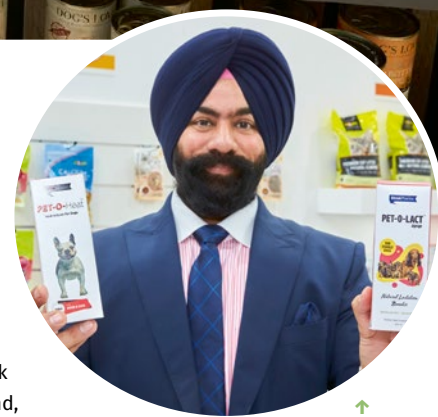
↑ Ook Indiase leveranciers presenteerden hun producten op de Interzoo.

van tevoren van een aantal vertegenwoordigers al wel gehoord dat de beurs met name qua formaat indrukwekkend was, maar als je er dan zelf rondloopt krijg je pas echt beeld. Zo veel hallen, zo veel exposanten, zo veel kilometers maken: ik vond het echt overweldigend, maar ook heel leuk. En dan waren de exposanten uit China er nog niet eens. Ik heb er een volle dag rondgelopen, alle hallen gezien, maar dan duizelt ‘t je aan het einde van de dag van de indrukken. Om alles echt goed te bekijken heb je wel drie dagen nodig.