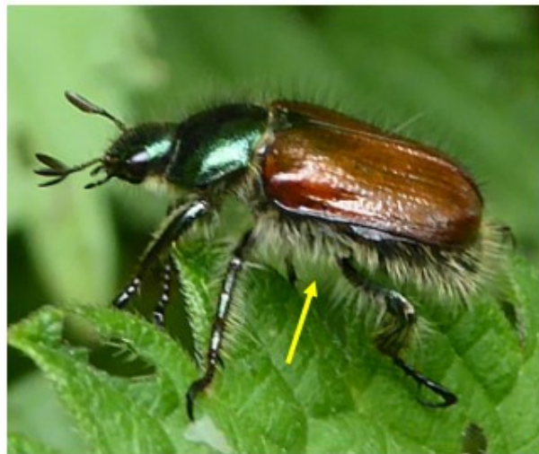
De rozenkever, met verspreid staande haren.