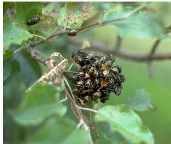
Schade Popillia japonica op Malus