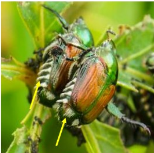
Popillia japonica met witte haren in plukjes.

De poppen van Popillia japonica zijn alleen door een expert te onderscheiden van andere bladspruitkevers, zoals de mei- en junikever. Ook bij larven wordt identificatie door een expert aanbevolen.