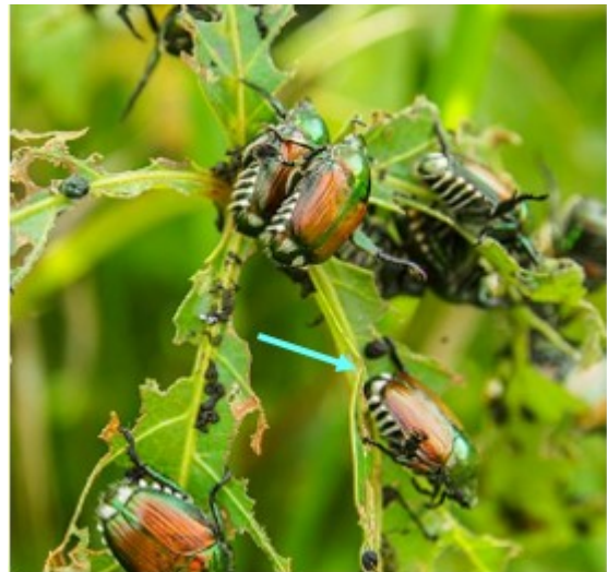
Popillia japonica met witte haren in plukjes.