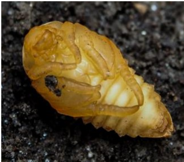
Popillia japonica pop.