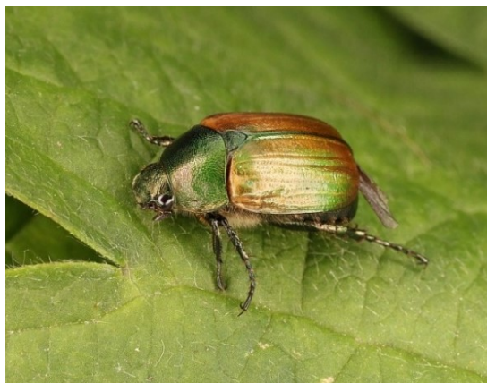
Anomala dubia