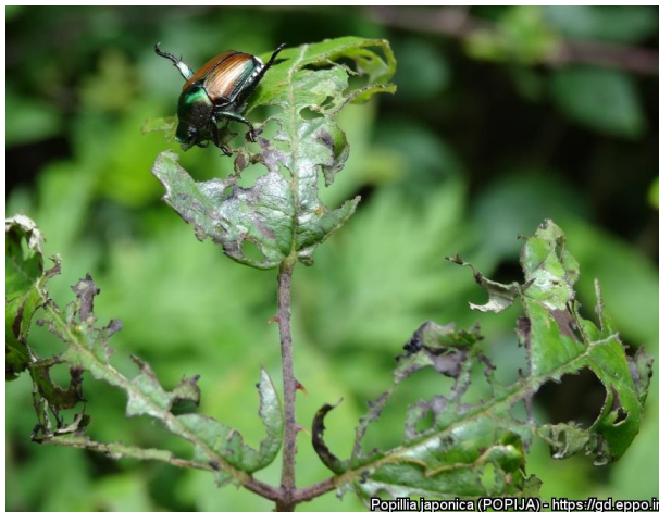
Schade Popillia japonica op Rubus

De vraat door de kevers veroorzaakt grote gaten in bladeren, bloemen, stengels en vruchten. Van de bladeren blijven alleen de nerven over met soms een dun laagje plantenweefsel ertussen. De bladresten worden bruin en vallen af. De schade kan lijken op rupsenschade. Adulten komen vaak in grote groepen voor. De larven leven in de grond en geven vrachtschade aan de wortels. Poppen zitten eveneens in de grond.