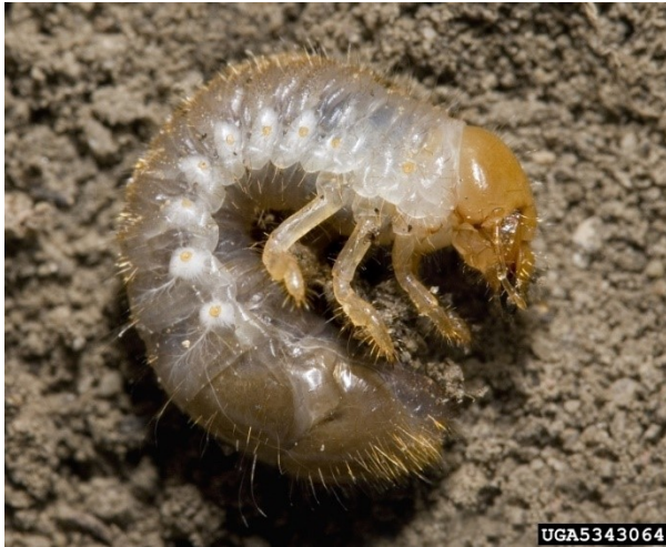
Popillia japonica larve met 3 paar lange poten en opgezwollen uiteinde.