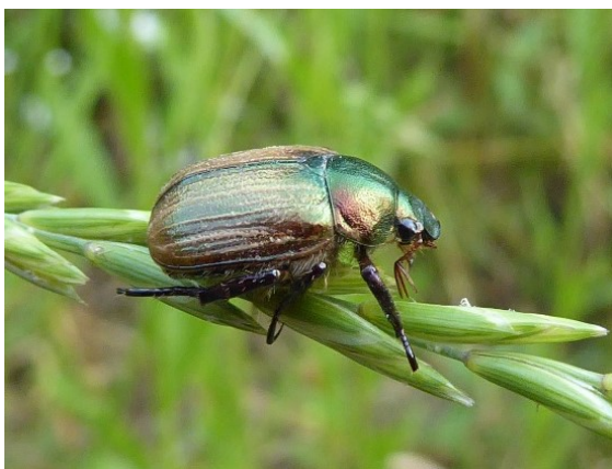
Mimela junii .