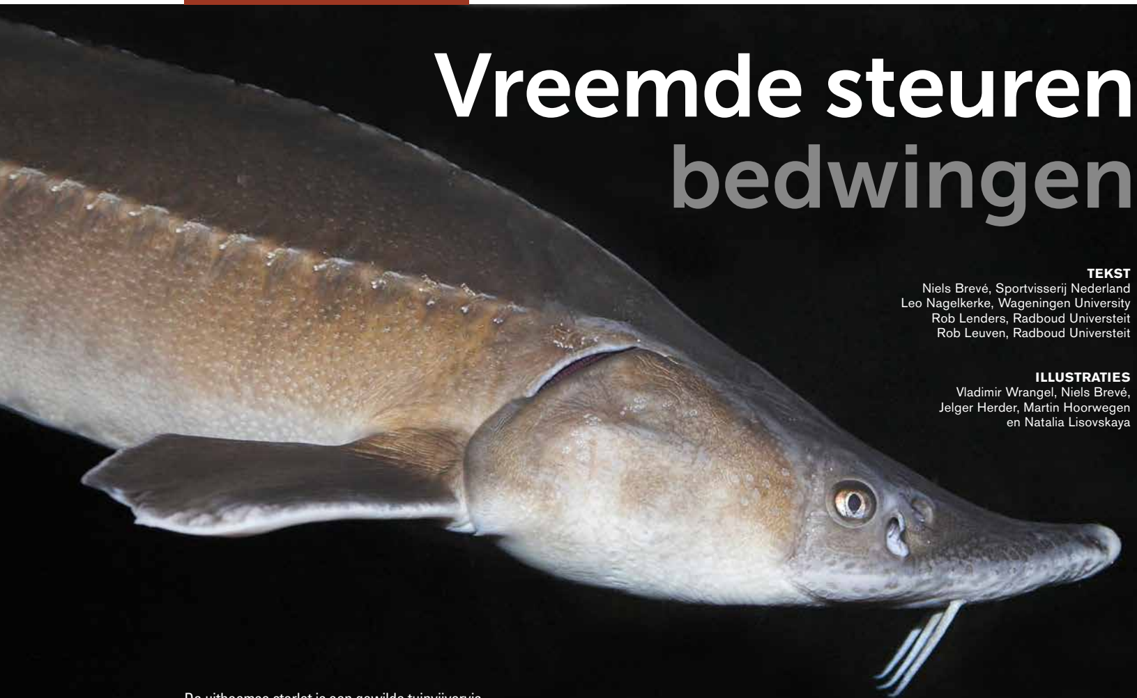
De uitheemse sterlet is een gewilde tuinvijvervis.