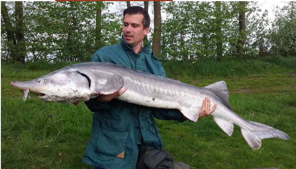
Een beluga is een imposante verschijning. De vraag is of deze soort in een vijver thuishoort.

en daar gaan ze lang niet altijd op in, onder meer vanwege risico's van parasieten en visziekten. Het alternatief is het loslaten van een steur in de vrije natuur. Met alle risico's van dien, daarnaast is het verboden.