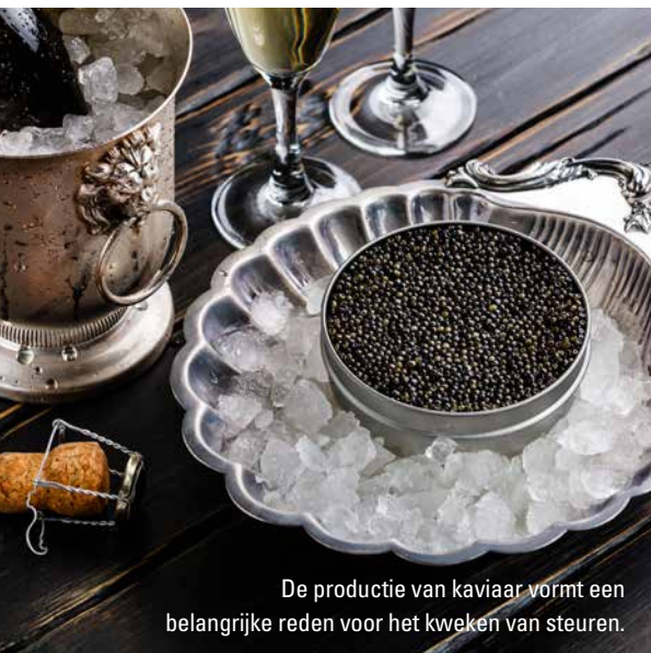
De productie van kaviaar vormt een belangrijke reden voor het kweken van steuren.

ook te maken hebben met het formaat of de leeftijd van een steur. Exotische steuren zijn niet alleen eenvoudig verkrijgbaar maar kunnen namelijk heel groot en meer dan 50 jaar oud worden. Het is ongetwijfeld aan niet veel eigenaren gegeven om zoveel tijd en ruimte te besteden aan een vis. Maar het is ook niet eenvoudig om met goed fatsoen van zo'n enorm huisdier af te komen. Steurkwekerijen krijgen regelmatig vijversteuren aangeboden ➤