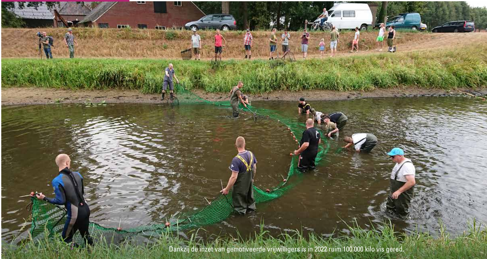
Dankzij de inzet van gemotiveerde vrijwilligers is in 2022 ruim 100.000 kilo vis gered.