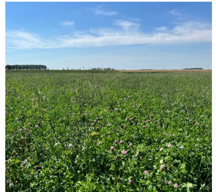
(c) Productief kruidenhoudend grasland, ca. > 30 soorten, met een zeer divers mengsel met klavers, weegbree, grassen, etc. Grassen stonden ertussen, maar onder de kruiden. De bodem voelde nog vochtig aan.