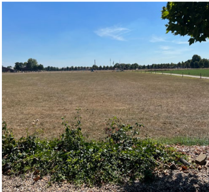
(a) Monocultuur Engels raaigras