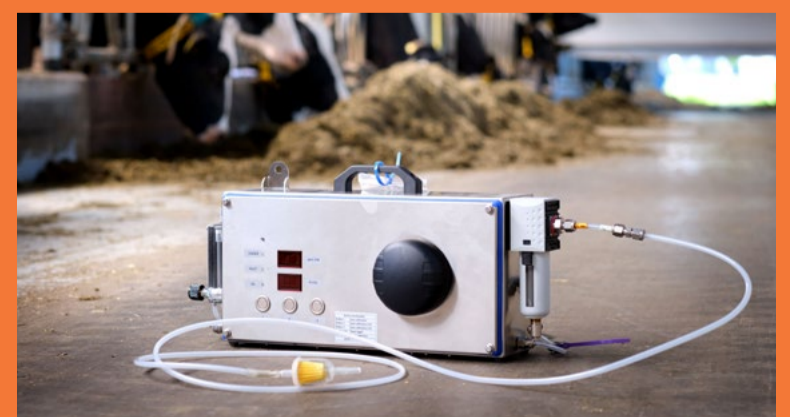
De metingen worden genomen met een 'sniffer' die methaanconcentraties meet in de voerbak van de melkrobot.