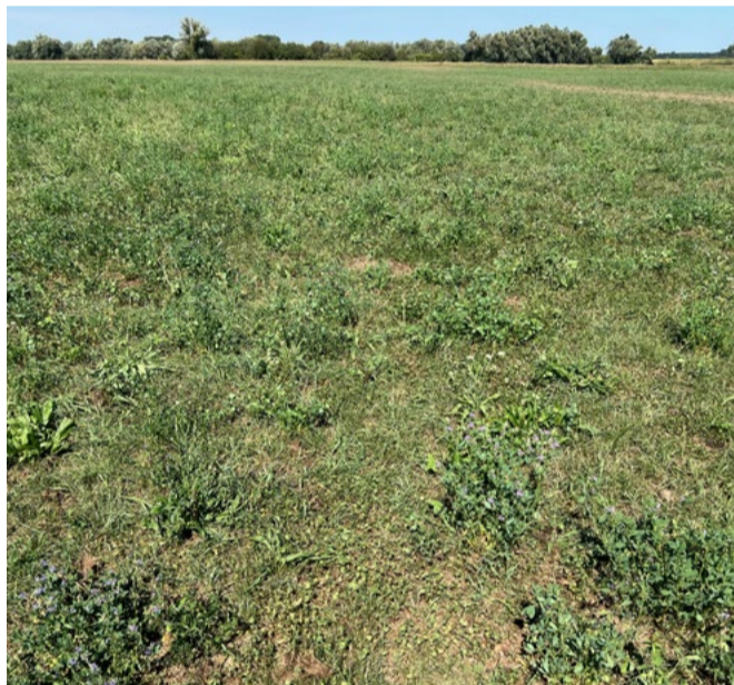
(b) Productief kruidenhoudend grasland met ca. 15 verschillende soorten grassen en kruiden. Ondanks de droogte nog redelijk wat kruiden en grassen die groen zijn.