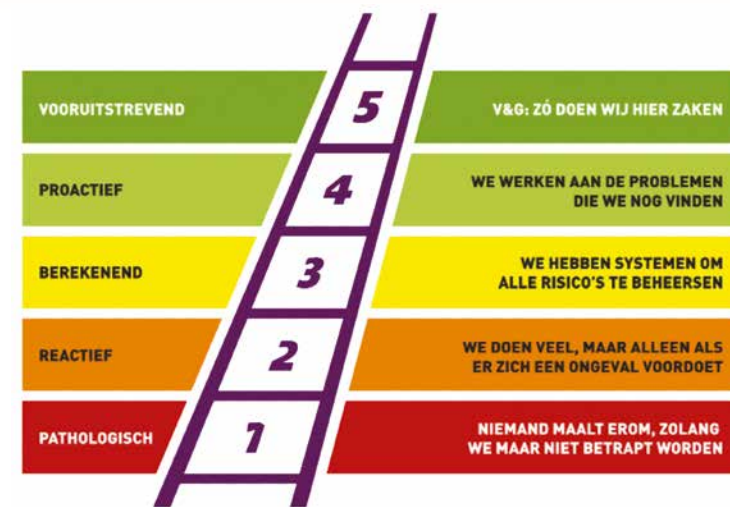
Figuur 2. De vijf treden van de veiligheidsladder.

“Dat is nogal wat. Ik heb nooit geweten dat er zoveel komt kijken om wat vrijwilligerswerk te doen. Het lijkt wel op echt werk!” Ja, ook vrijwilligers dienen veilig zijn werk te kunnen doen, net