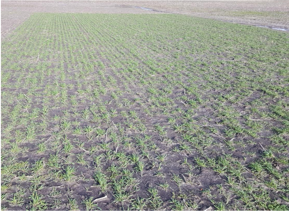
Figuur 4 Stand van Rogge in maart 2020.