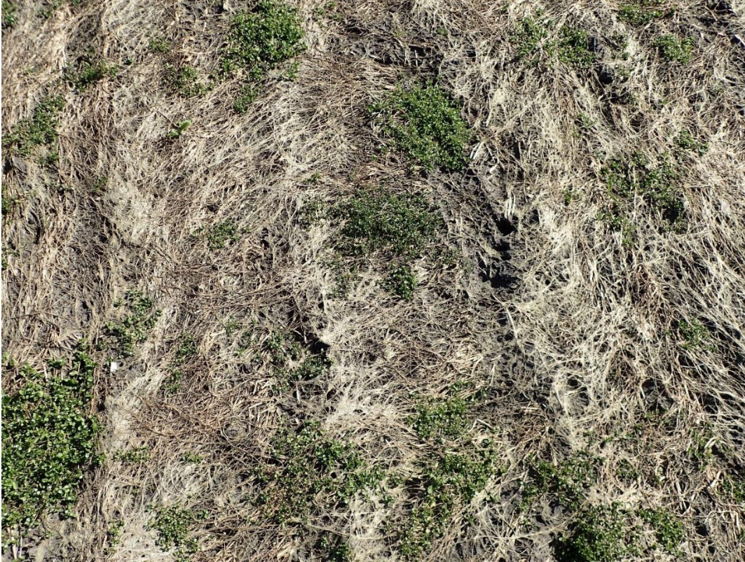
Figuur 2 Japanse haver in april 2019 (doodgevroren met veronkruiding door muur).

Het gewas, de stengels en het blad van de Japanse haver, bedekt de grond in zekere mate (Figuur 2). Desondanks is er groei van sterke ontwikkeld onkruid, vooral muur. Er is geen plant telling uitgevoerd, daarmee zijn er geen absolute cijfers verzameld.