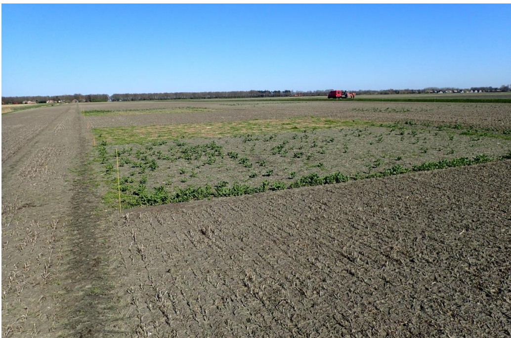
Figuur 1 Stand van de groenbemers in april 2019. Op de voorgrond het object Tagetes, gevolgd door bladrammenas en Japanse Haver.

Figuur 1 laat de stand van de groenbemers zien op 1 april 2019. Het gedeelte van de proef waarvan de groenbemers nog ondergewerkt moesten worden na de winter is zichtbaar op deze foto. Zichtbaar zijn goed ontwikkelde groenbemers, echter afgestorven n.a.v. vorst. Daardoor was er ruimte voor de ontwikkeling van onkruiden.