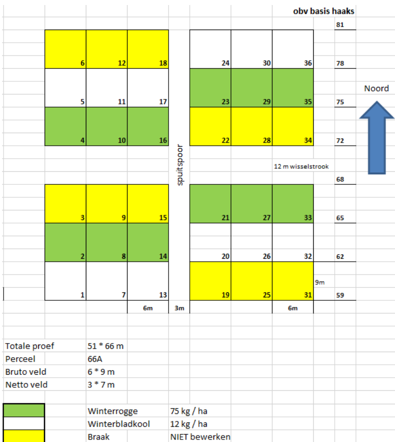
Figuur 6 Proefopzet groenbemesterproef 2020/2021.

Ook in 2020 is geëxperimenteerd met een wintergroen vanggewas ( Figuur 6 ). Deze is ingezaaid op 13 november 2020 na de teelt van fabrieksaardappel met als volggewas suikerbiet. Rond half december is het eerste gedeelte (6 van 12 velden) van de proef ondergewerkt. Het andere deel van de groenbemesterproef is in het voorjaar met de grondbewerkingen vernietigd. In 2021 zijn suikerbieten gezaaid.