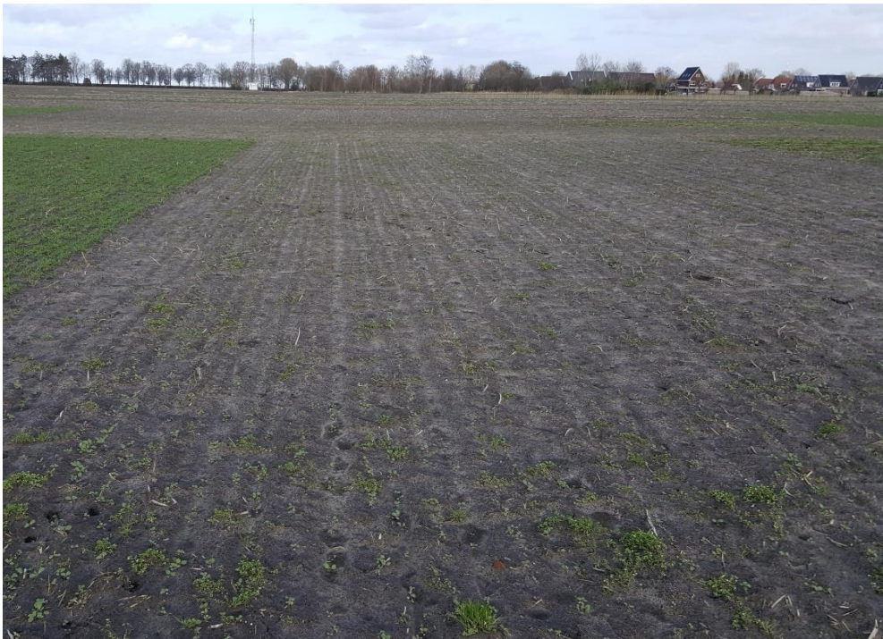
Figuur 5 Stand Winterkool in maart 2020.