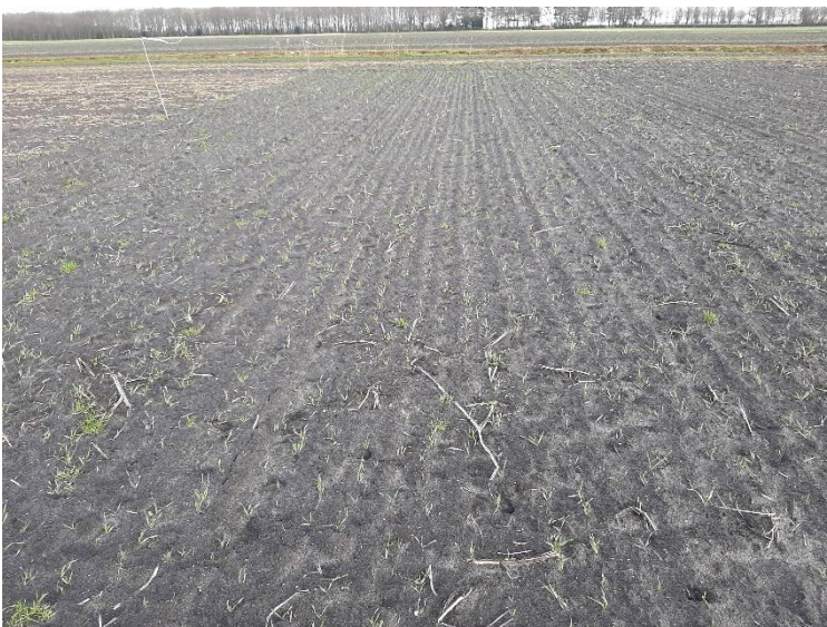
Figuur 8 De stand van de rogge op 26 januari 2021.