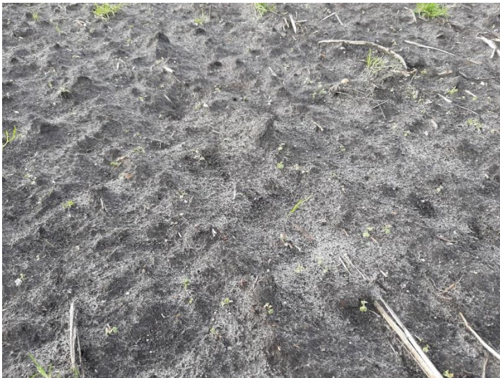
Figuur 7 De stand van winterkool op 26 januari 2021.

De mate van bodembedekking door groenbemester is op 26 januari 2021 vastgesteld. Daaruit bleek dat de laat ingezaaide vanggewassen nauwelijks biomassa hadden geproduceerd. Uit de figuren 7 (winterkool) en 8 (winterrogge) blijkt dat er eigenlijk geen groei was geweest van de wintergroene groenbemesters. Hiermee was de proef niet succesvol en kunnen er mag worden geconcludeerd dat de doelstelling om onkruiden te onderdrukken met groenbemesters niet is gelukt.