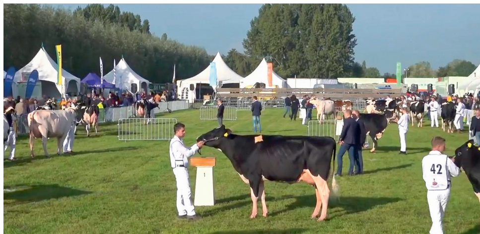
Het hart van Fokveedag Boerenlandfeest ligt nog steeds bij de koeienkeuring

centrum Het Bruisend Hart in Hoornaar. Er zijn verschillende categorieën, zoals jonge kaas, kruidenkaas en geitenkaas. De kazen zijn tijdens Fokveedag Boerenlandfeest te proeven door bezoekers en de winnaars worden aan het einde van de dag bekendgemaakt. Zo verbindt het evenement niet alleen boer en burger, maar ook boer en consument.