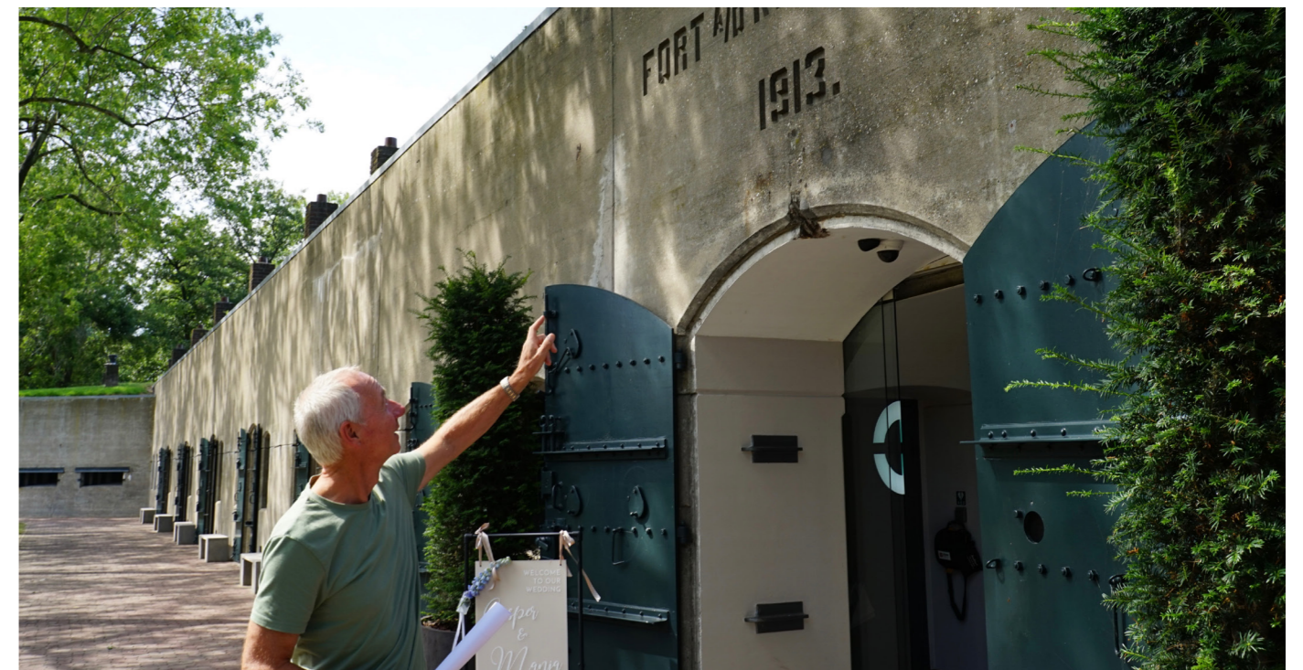
Fort behorend bij de Stelling van Amsterdam, nu in gebruik als wellnessresort.

noemd. Daarin past goed om bij nieuwe ontwikkelingen eerst vast te stellen wat de kwaliteiten zijn die een rol moeten spelen in verdere ontwikkeling en die zo concreet mogelijk uit te werken. Een mooi voorbeeld daarvan vind ik de nota Beemstermaat, waarin de voormalige gemeente Beemster vrij specifiek uitwerkt hoe ze nieuwe ontwikkelingen, zoals groeiende mobiliteit, wil inpassen in dit landschap. Historiserend bouwen had echter niet gehoeven, als je toch bouwt dan hoef je dat niet te verstoppen. Ook hieruit kunnen nieuwe iconen ontstaan. Maar borduur wel voort op het bestaande ritme van het Beemster landschap.”