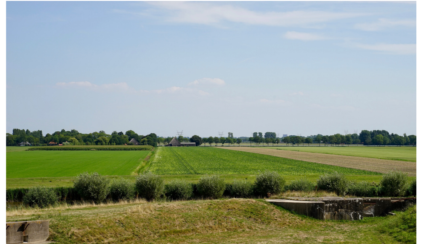
Kavels en boerderijen in de Beemster, met op de voorgrond verdedigingswerken van het Fort bij Spijkerboor.