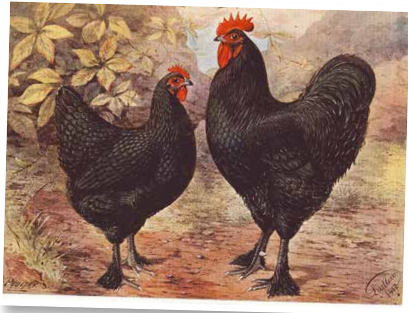
Langshans, getekend door Ludlow in 1912.