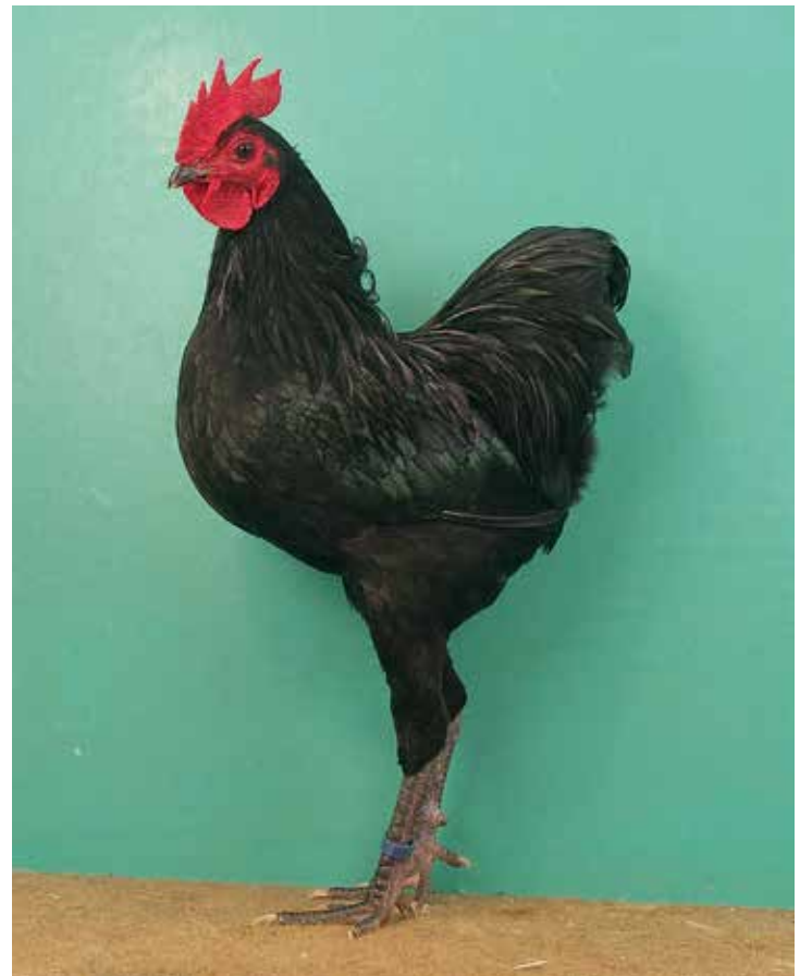
Een winnende zwarte haan op de Europashow in Leipzig (2006). De stelling is fraai, de halsbevedering lijkt wat ruw.