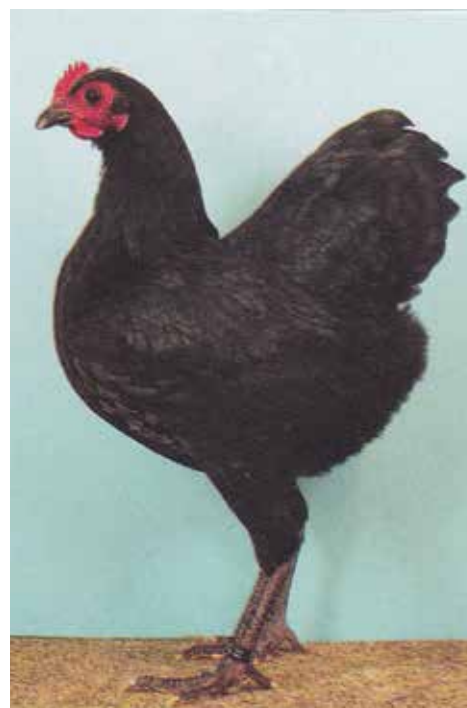
Zwarte Langshan krielhen van W. Stockmann.