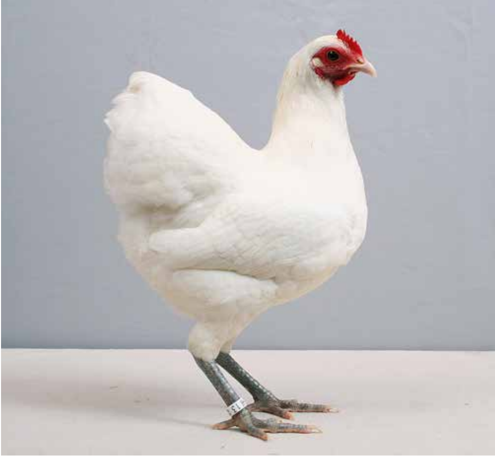
Witte Langshan krielhen. (W. Hoekstra)