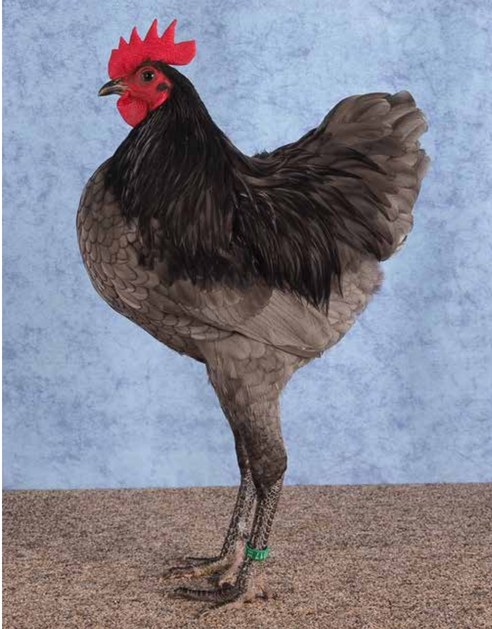
Jonge blauwe Langshan krielhaan (Duits type) van G. Laarman met een fraai type.

Maar volgen wij ook de Duitse standaard? In grote lijnen, ja, maar bij de beoordeling is er een verschil in accenten tussen Nederland en Duitsland. Wij waarderen een hoge stelling en een strakke rug-staartlijn zeer. In Duitsland zijn deze twee raskenmerken ook belangrijk, maar de staartafdekking is bij hen een wezenlijk en belangrijk onderdeel van de keuring. In Nederland kom je een opmerking over dit onderdeel zelden tegen op de beoordelingskaart. In Duitsland daarentegen wordt de staartafdekking (in het Duits Abschluss) altijd vermeld op de kaart. Als de staartdekveren de staartstuurpennen niet geheel afdekken, krijg je direct puntenaftrek, minimaal één punt.