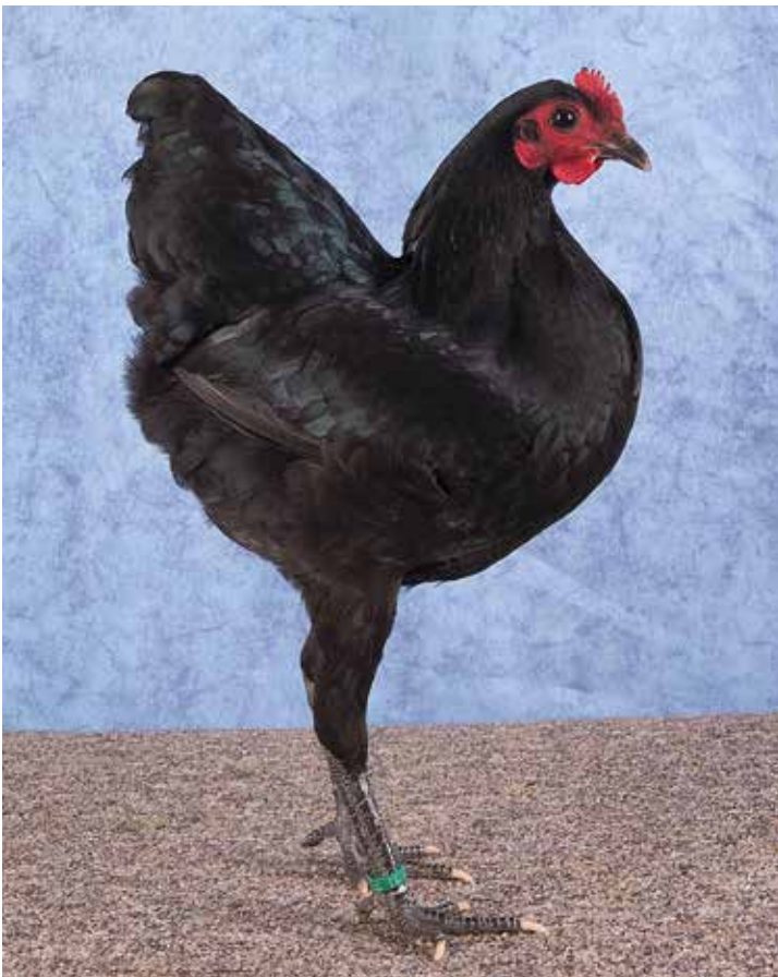
Deze zwarte jonge Langshan krielhen van G. Laarman werd de fraaiste van de keurmeester en behaalde een F96 op de Oneto 2019.

Voor wie een rustig, elegant showras en een typedier bij uitstek wil hebben zijn Langshan krielen een aanrader. <<