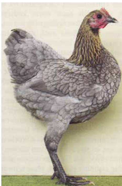
Langshan krielhen in blauw goudberken van W. Bohne. (Archief Langshanclub)