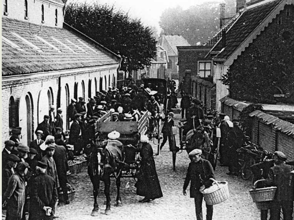
Eierhal Barneveld 1913.

in Den Haag. Het ging daarbij vooral om de grote bruine eieren! In hetzelfde jaar werd er door de VPN in Amersfoort een proeffokstation opgericht. In 1913 werd in Barneveld een grotere stenen eierhal in gebruik genomen (gesloopt in 1963). Tot de Eerste Wereldoorlog was de Barnevelder vrijwel onbekend buiten Barneveld. In 1915 werd de Pluimvee Vereniging Wageningen opgericht. In 1915 werden er in de nieuwe eierhal in Nijkerk -gebouwd in 1913-, bijna 14 miljoen eieren verhandeld. Na een brand in 1920 verrees er in 1927 een nieuwe eierhal. De aanvoer van eieren bedroeg in 1930 ruim 11 miljoen eieren.