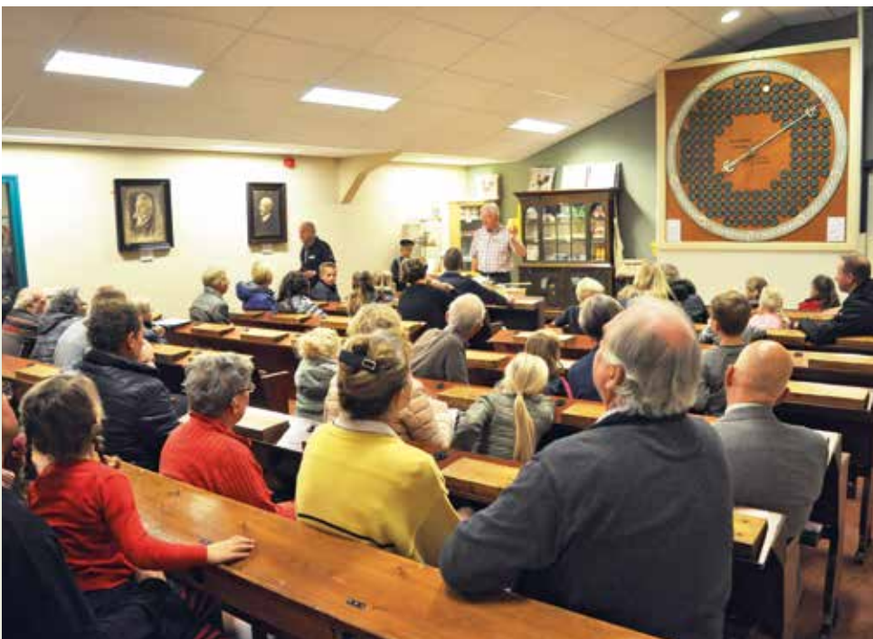
Eierveiling Barneveld (Pluimveemuseum).