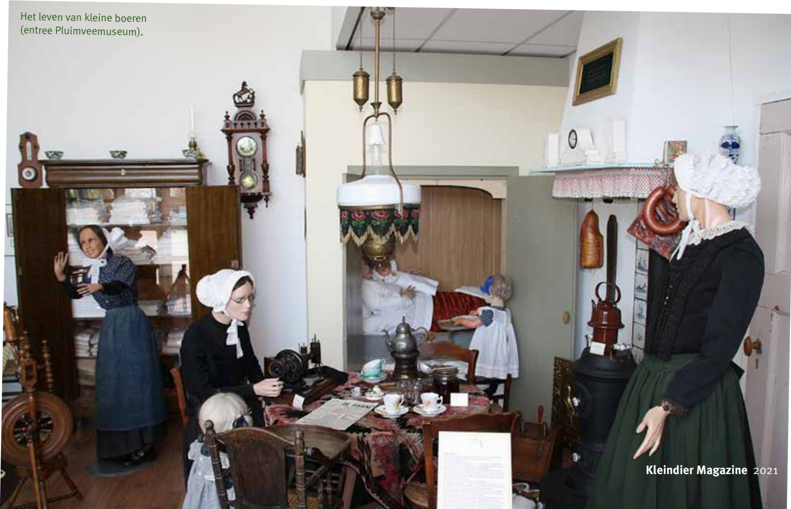
Het leven van kleine boeren (entree Pluimveemuseum).

hoenders uit Engeland geïmporteerd. Beide bevolkingsgroepen hadden vrijwel geen contact over hun kippen. De Vereniging tot Bevordering der Pluimveehouderij en tamme konijnenteelt in Nederland (VPN) speelde de eerste twee decennia van de 20e eeuw een stimulerende rol in de bedrijfspluimveehouderij. Via de VPN werden o.a. hanen gratis of tegen een lage prijs aangeboden om de populatie te verbeteren. Kruisingen van de boerenlandhoenders met de hanen van Aziatische rassen als Cochin, Maleier, Langshan, Brahma en later Wyandotte leidden tot o.a. de Barnevelder, bruine eieren (hogere