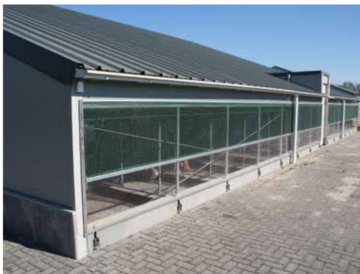
De nieuwe Kippenhal in het Plumveemuseum.