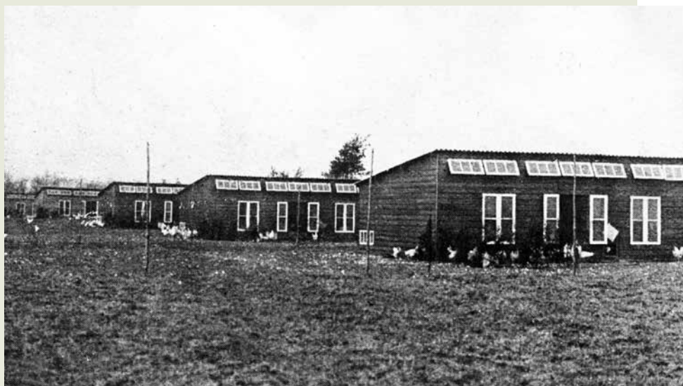
Hoenderpark Corona te Voorthuizen.