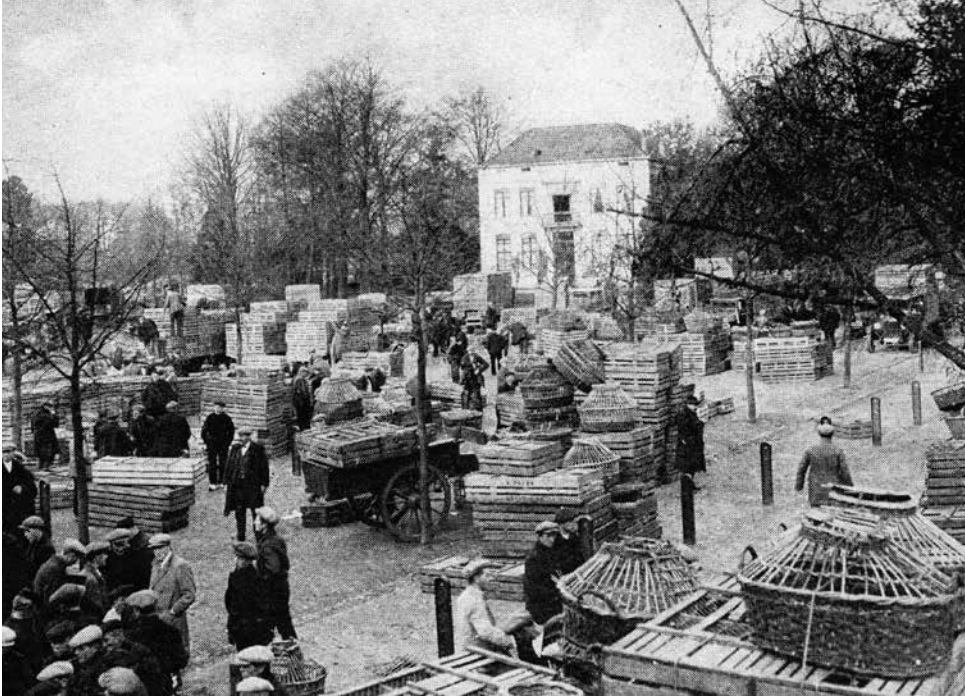
Kippenmarkt in Barneveld.

werd ongeveer 40 jaren voor de eierhandel gebruikt. In 1927 komt de nieuwe markthal in Barneveld klaar en wordt ook de Coöperatieve Veluwse Eier-afzetvereniging (C.V.E.) opgericht. In 1927 organiseerde de afdeling van de Bond van Eierhandelaren Barneveld en Omstreken een pluimveetentoonstelling in de nieuwe eierhal. De gemeente stelde zilveren kandelaars voor de beste collectie Barnevelders beschikbaar. De vereniging 'De Beste Barnevelder' organiseerde in 1928 een pluimveetentoonstelling. Er was ook een kippenmarkt in Barneveld.