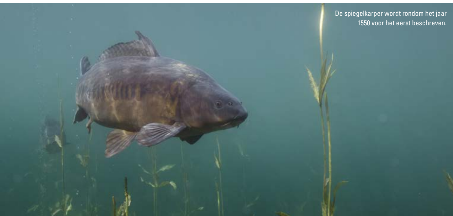
De spiegelkarper wordt rondom het jaar 1550 voor het eerst beschreven.

Door menselijke ingrijpen is de karper door de voorbije eeuwen heen veel van zijn wilde uiterlijk kwijtgeraakt. Van tijd tot tijd verscheen er in de kweekvijvers van weleer een zeldzame karper met een onvolledig schubbenpatroon. Deze gedaanteverandering lag niet aan het kweekproces ten grondslag, maar wordt