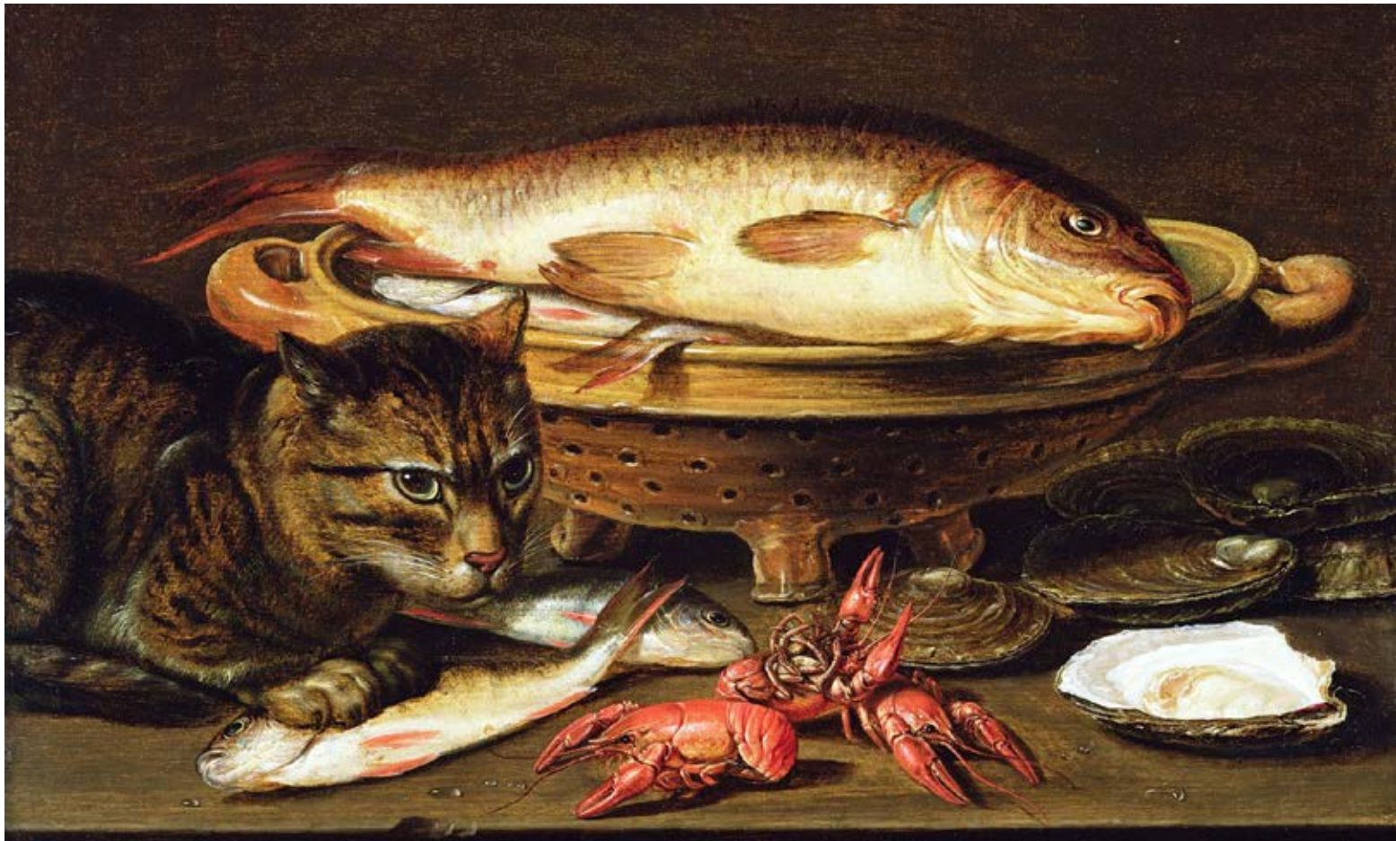
Stilleven met een karper in een keramisch vergiet, oesters, rivierkreeften, voorn en een kat | Clara Peeters | Datum onbekend | Privécollectie.

Nogal wat composities van Peeters lijken op het hier afgebeelde schilderij. De grote karper figureert met dezelfde grootte en vorm in andere van haar visstillevens, meestal gelegen bij duur exclusief eetgerei, wat de status van de karper als elitaire consumptievis extra benadrukt. ■