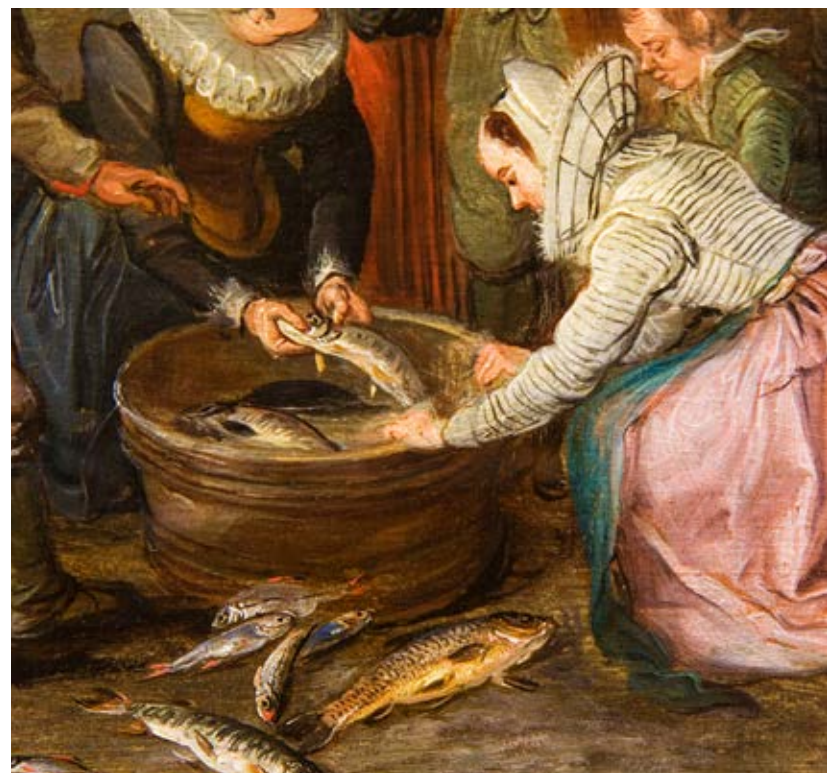
Jaarmarkt in Schelle | Jan Brueghel de Oudere | 1614 | Kunsthistorisches Museum Wenen.