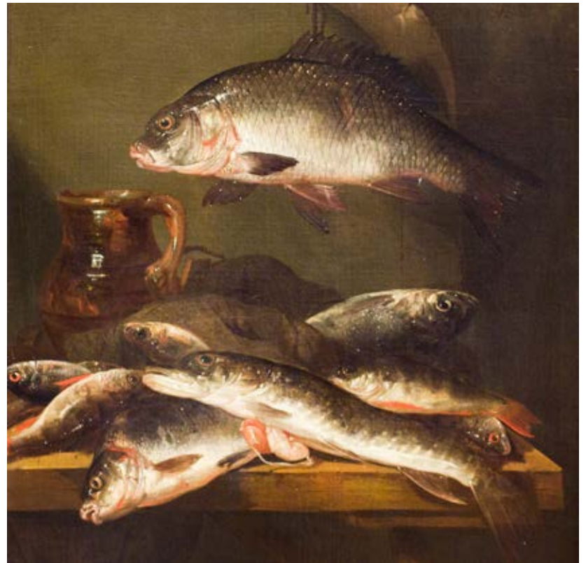
Stilleven met karper | Abraham van Beyeren | 1646-1650 | Het Louvre Parijs.

Waarom de karper zo wonderwel bestand is tegen zuurstoftekorten is overigens al een tijd geen geheim meer. In 2006 ontdekte een wetenschapsteam aan de universiteit van Liverpool de sleutel tot dit levensgeheim. De knappe koppen maakten melding van een speciaal eiwit, genaamd myglobine. Het stofje fungeert als opslagplaats van zuurstof in de hartcellen en spieren van alle gewervelde organismen. Zoogdieren als walvissen en zeehonden, vermaard om hun lange duiken, bezitten hoge doseringen ervan. De ontdekking van dit eiwit was dan ook geen nieuws onder de zon, de plaats waar de onderzoekers het bij de karper aantreffen echter des te meer. Naast de gebruikelijke lichaamszones bevond zich het eiwit tevens in zijn hersenen. Een analyse van het stofje maakte duidelijk dat het bovendien ging om een nog onbekende variant. De karper geldt als het eerste gewervelde organisme waar de wetenschap twee