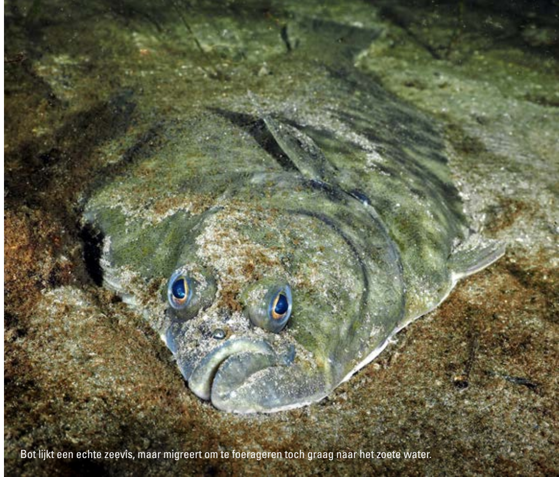
Bot lijkt een echte zeevis, maar migreert om te foerageren toch graag naar het zoete water.

Het gaat niet echt vlot, concludeert Van der Heij, maar hij is optimistisch: "Financiering kan komen uit Den Haag, waar geld uit de Programmatische Aanpak Grotere Wateren