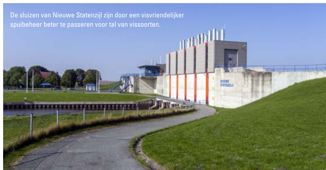
De sluisen van Nieuwe Stanzijl zijn door een visvriendelijker spui-beheer beter te passeren voor tal van vissoorten.

Nu dat duidelijk is, willen boeren meedenken. In de plannen moeten we verder rekening houden met de toevoer van zoet water. Rijkswaterstaat spoelt heel Friesland door met zoet water uit het IJsselmeer, maar waarschuwt dat dat bij toenemende droogte steeds moeilijker wordt. Dat zou kunnen betekenen dat het Lauwersmeer als zoetwaterbuffer gaat fungeren en dat willen we niet. We kiezen voor het inrichten van bufferingsgebieden hogerop in het watersysteem, onder andere om inklinking tegen te gaan. Vasthouden van water moet op lokaal of regionaal niveau plaatsvinden.”