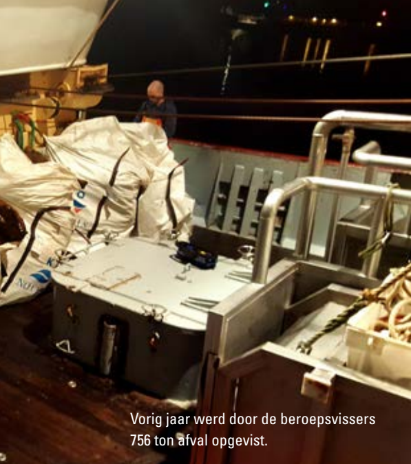
Vorig jaar werd door de beroepsvissers 756 ton afval opgevist.