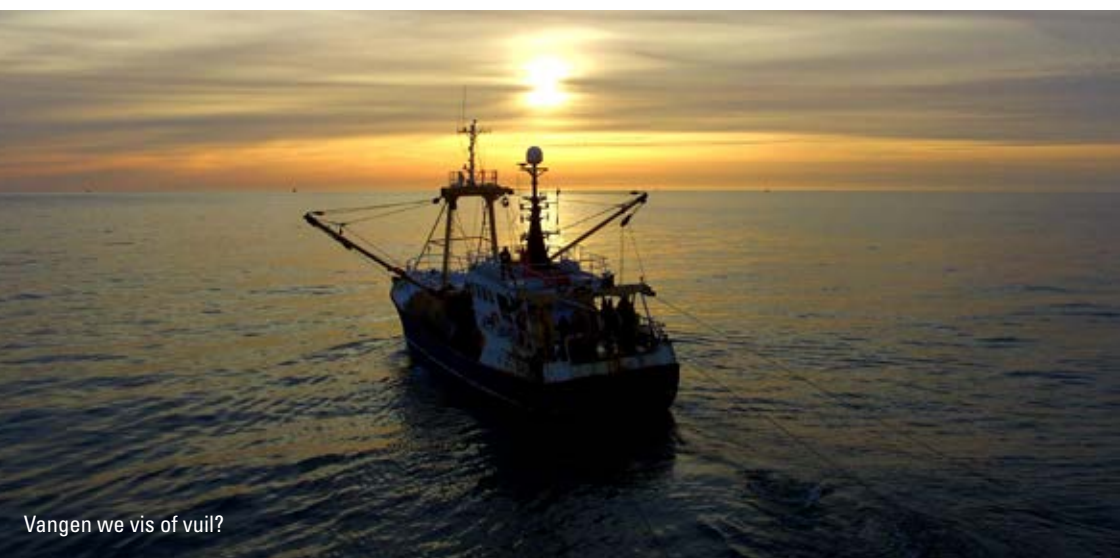
Vangen we vis of vuil?