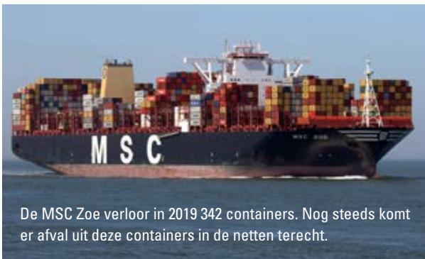
De MSC Zoe verloor in 2019 342 containers. Nog steeds komt er afval uit deze containers in de netten terecht.