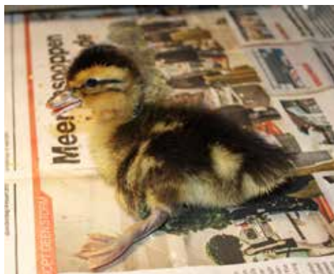
Spreadpoten, meestal krijgt de ondergrond de schuld, maar is dit wel zo?

De oorzaak van steekvleugels is nog onbekend. We geven hier wat mogelijke oorzaken, doe er uw voordeel mee. In het algemeen nemen we aan een te snelle groei, waarbij de spieren het gewicht van de snelle groei van de vleugelpennen niet