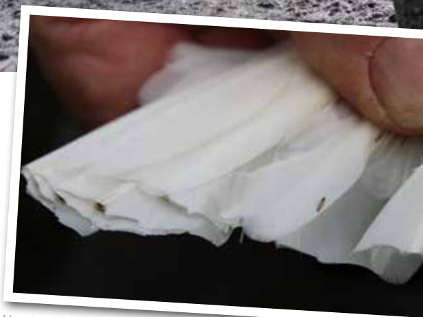
Veerluis op een geknipte Kwakervleugel.

ongedierte zich pas massaal voortplant nadat de veerconditie door andere oorzaken slecht geworden is, weet ik niet.