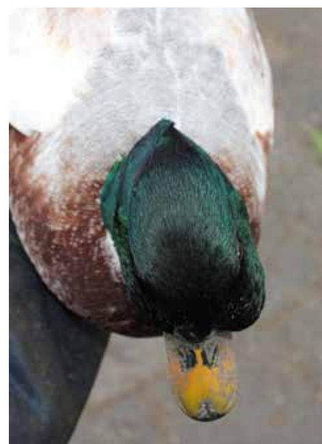
Kwaker met een opgezette wang veroorzaakt door de Synovitis arthritis hepatitis bacterie.

De meeste eenden sterven in de eerste twee levensweken. In de vrije natuur en bij natuur opfok worden vaak reigers, snoeken en