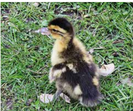
Ook op een natuurlijke bodem blijven de poten gespreid.

Het is bijna niet voor te stellen maar ook eenden die het grootste deel van de dag op het water doorbrengen kunnen last van luizen en mijten hebben. Ze kunnen er zelfs 'lek' van worden. Dan is de veerconditie zo slecht dat het niet meer waterafstotend is. Of dit door het ongedierte komt of dat het