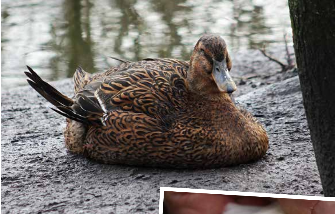
Roueneend van het Engelse type met een steekvleugel.

kunnen bijbenen. Bedenk dat de hulzen waarin de vleugelpennen groeien gevuld zijn met bloed en dus heel zwaar zijn. Vooral als ze zich gelijk ontwikkelen en niet één voor één. De oorzaak van deze snelle groei kan een combinatie van warmte en verkeerd eiwitrijk voer zijn. Het twee à drie weken samenbinden van de vleugelgewrichten -als u een beginnende steekvleugel waarneemt- levert levenslang goede vleugels op. Hieruit kunnen we concluderen dat het geen erfelijke fout is. Het is een weelde ziekte, de beschikbare voeders zijn te goed voor snelgroeiende rassen die vroeger snel en veel vlees moesten leveren. We moeten kijken hoe men vroeger deze snelgroeiende rassen opfokte, het zijn bijna altijd de vreetzakken die problemen krijgen.