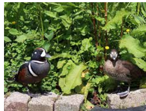
Bij duurdere soorten, zoals hier een koppel Harlekijneenden, komt het enten tegen eendenhepatitis of de eendenpest vaker voor dan bij goedkopere soorten.

kraaien als de schuldige van de verliezen aangewezen. Ze zullen best wel eens een kuiken weg snoepen, maar de meesten overlijden door onderkoeling, voedselgebrek en de virusziekten, eendenpest of