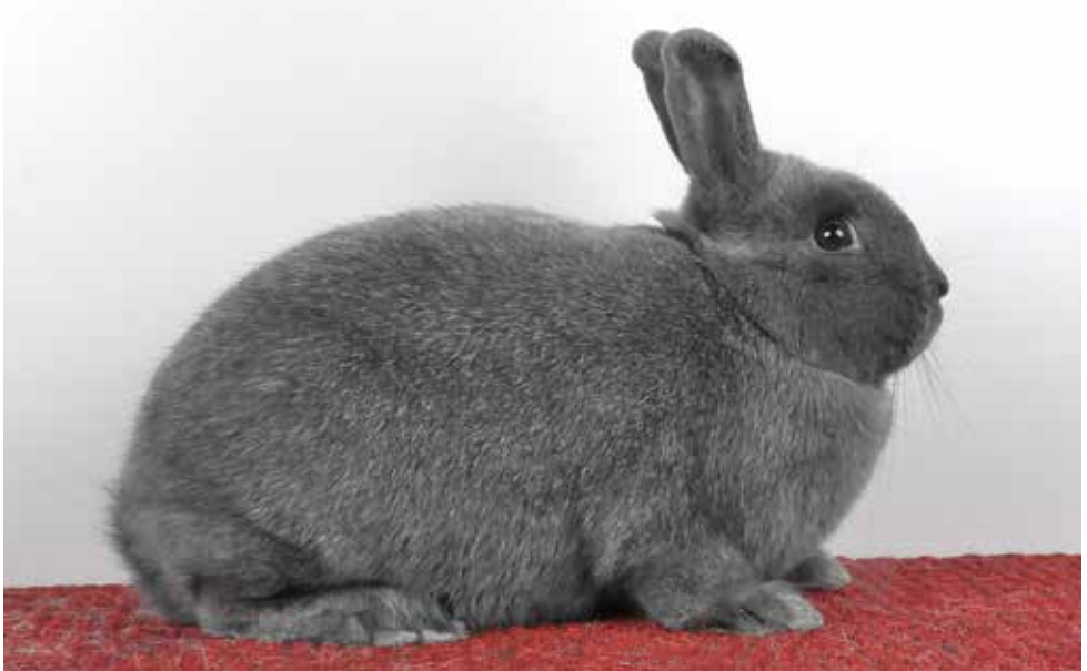
Klein Zilver middenblauw, voor het eerst gebracht door de Engelse fokker Entwistle en zijn zoon. (Theo Janssen)