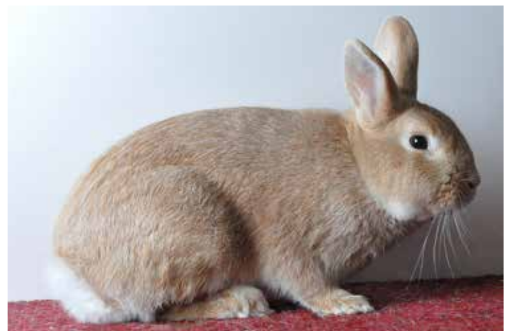
Klein Zilver middengeel. (Theo Janssen)