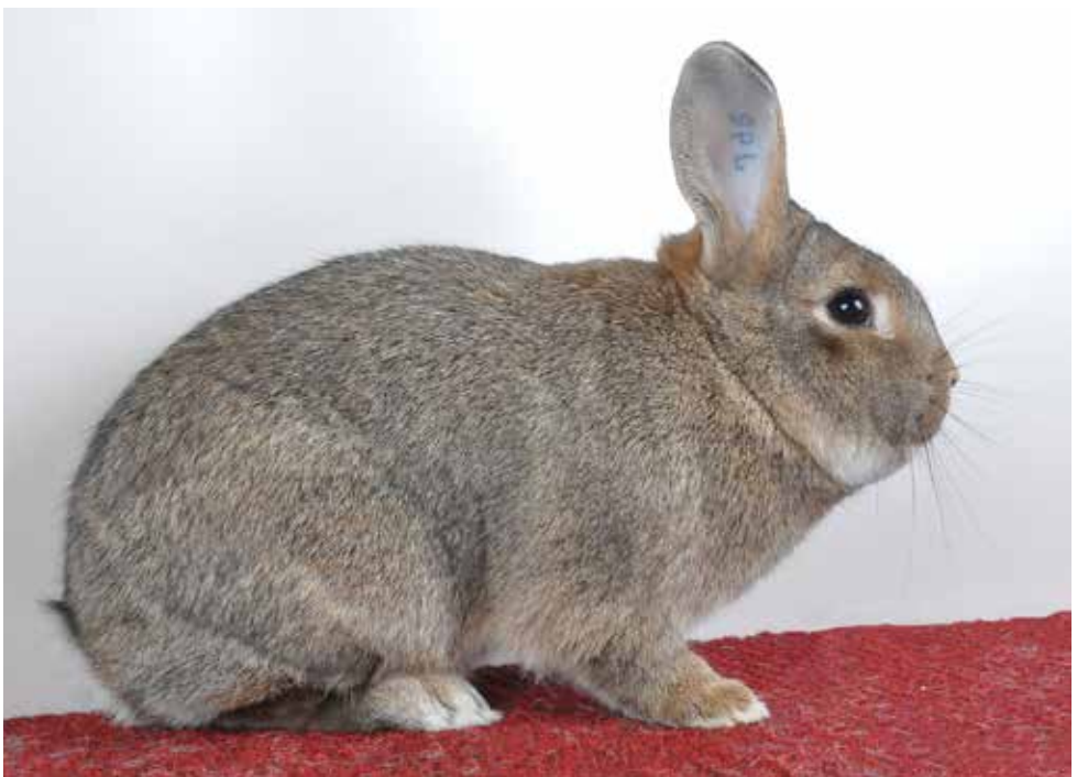
Middenkonijn grijs, de zilverbruine (konijn grijszilver) hebben we aan A. Reichel in de Duitse gemeente Höhenstein-Ernstthal te danken. (Theo Janssen)