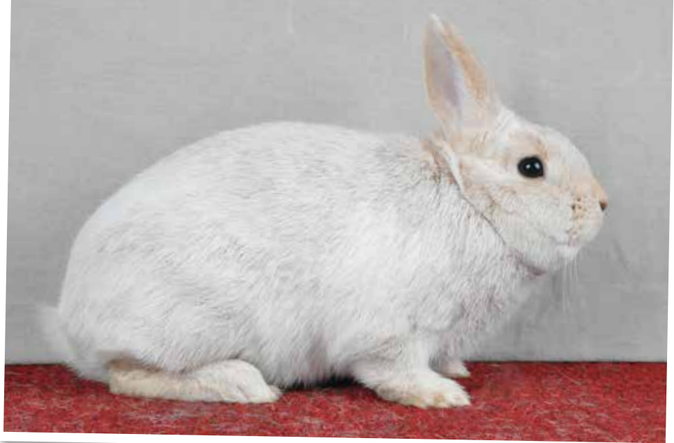
Klein Zilver lichtgeel. (Theo Janssen)

In de eerste helft van de 19 de eeuw had het Engelse Zilverkonijn al de grootte en de vorm van een wild konijn met een middenverzilvering. Deze van oorsprong Franse konijnen waren middelgroot en blijkbaar eveneens verzilverd. Eugène Meslay schreef in zijn boek Les races de lapins (1900) dat in de provincie Champagne de fokkers meer en meer waren overgegaan ze te fokken en deze dieren meer bekendheid wilden geven om de nutwaarde te verhogen en om grotere vellen en meer vlees te verkrijgen. Mode was ook van invloed, fokkers die de mode volgden brachten een Zilverkonijn op de markt die in pelskleur zeer licht was en veel lichter dan de tot dan toe getoonde Zilver met een zeer lichte blauwachtige onderkleur als middelgroot ras. Ze noemden het Champagne Zilver. Later is die door ons omgezet in lichtzilver. Uit een bericht van John.Lawrence in 1823 bleek dat in het Graafschap Lincolnshire alle Kleinzilveren verdrongen waren door de import van de Franse Champagne Zilveren.