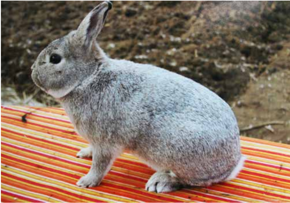
L'Argenté Anglais, Engels ras.

pigment bij. Het nieuwe haar wordt zo weer in zijn oude kleurstaat teruggebracht. Bij een Zilver gebeurt dit proces niet. Een Zilver kan het pigment uit zijn haren niet terugtrekken, dit wordt belet door de factor P. Het stoot alle kleurpigmenten af die het op dat moment in de haren heeft. Het maakt wel weer nieuw pigment aan maar onvoldoende om de oude kleur terug te krijgen. Zodoende wordt het dier met elke haarwisseling lichter van kleur.