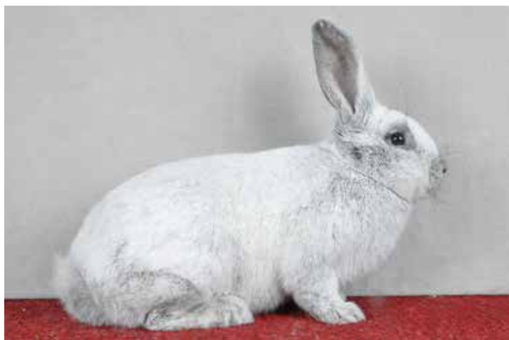
Groot Zilver lichtzwart. (Theo Janssen)