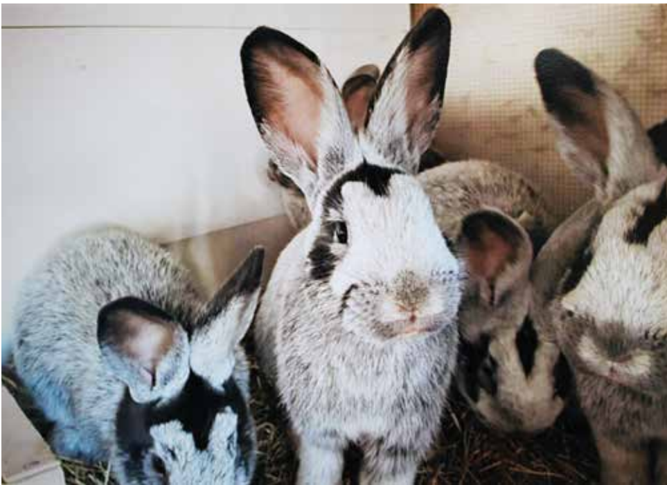
Duitse helle Gossilber in het proces van doorharen.

Deze waren aanmerkelijk groter dan de Klein Zilvers in Engeland. In de jaren 1870 werden de eerste Klein Zilvers naar Amerika geëxporteerd en het aantal steeg enorm. Ook vanuit Nederland werden ze geïmporteerd.