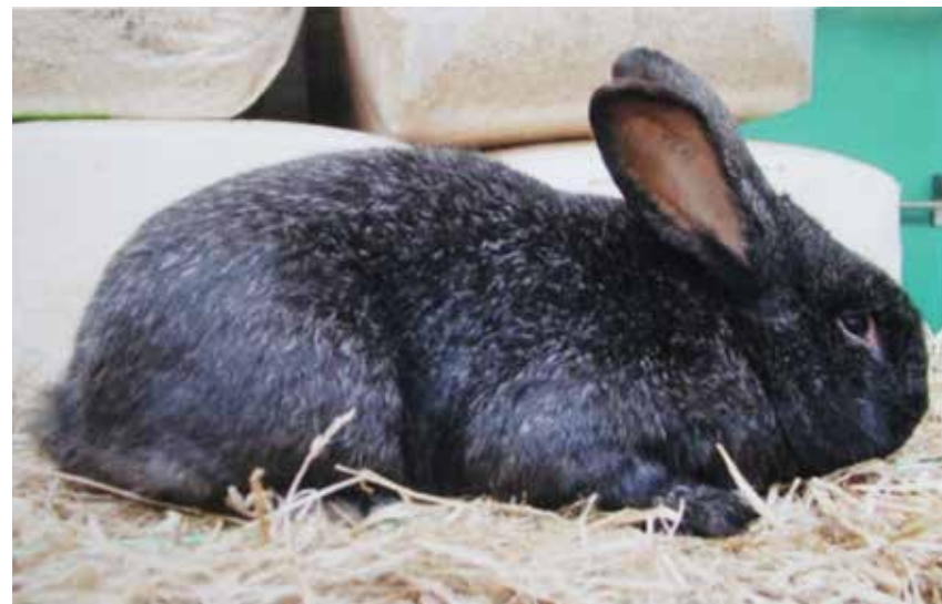
Groot Zilver middenzwart.