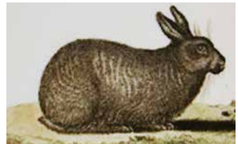
Voorouder Le Riche.

Wanneer een niet-zilver konijn met een 'normale' pels verhaart dan trekt het als eerste pigment terug. Dit pigment wordt opgeslagen in de huid. Als een konijn verhaart en het dier wordt geslacht dan zie je donkere plekken in de huid, dat is opgeslagen pigment. Dit pigment wordt aan het nieuwe haar toegevoegd en het maakt er iets