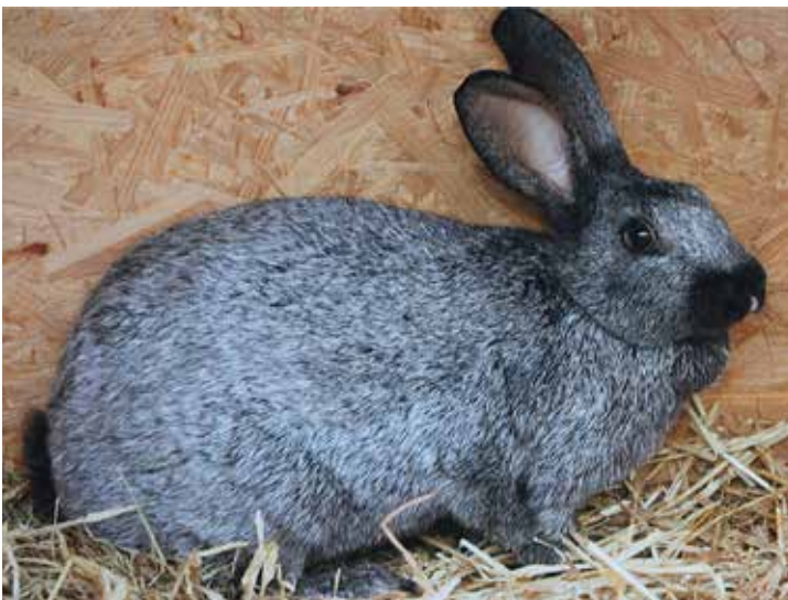
Belgisch Zilver https://sle.be/wat-levend-erfgoed/rassen/belgisch-zilver

In ons land werd het ras in 1907 in de eerste standaard reeds opgenomen en meteen in drie nuances beoordeeld en erkend. Het ging om vier kleurslagen te weten zwart- (zilvergrijs), blauw- (zilverblauw), geel/crème (zilverageel) en zilverbruin (konijngrijs zilver). Er werd bij vermeld dat de jongen zilvergrijs als zwart, zilverblauw als blauw, zilverageel als lichtgeel en zilverbruin als donker haaskleurig geboren werden. Later werd hier nog de kleur bruin (havana) aan toegevoegd. Tevens werd zilverbruin omgezet in konijngrijs zilver. Een aantal kleuren wordt intensief gefokt. Dit prachtige ras heeft bij ons ook steeds minder aanhangers. (NB. Gelet op het aantal mogelijkheden zou je meer verwachten. In Nederland kennen we nl. Groot- en Klein Zilver die erkend zijn in de kleuren konijngrijs, zwart, bruin, blauw en geel met drie nuances (licht, midden en donker) Dat levert 2 \times 5 \times 3 = 30 mogelijkheden op. En dan heb ik de Kleurdwerg zilver buiten beschouwing gelaten (HP). Op grotere tentoonstellingen komen we de Zilvers altijd wel tegen maar dan m.n. in de kleuren lichtzwart en licht konijngrijs. Een aantal echte doorzetters heeft het ras in andere nuances. De speciaalclub Nederlandse Zilver Club (NZC) werd in 1921 opgericht. <<