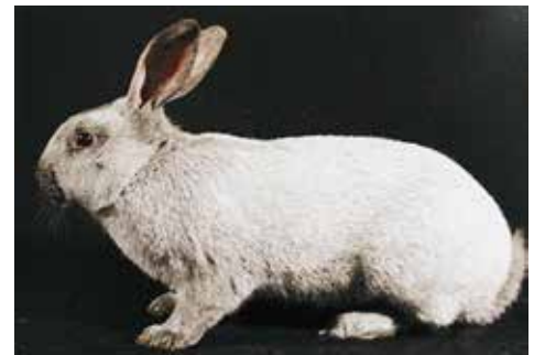
L'Argenté de Champagne, Frans Ras van gemiddelde grootte met een ideaal gewicht tussen 4,5 en 5 kg.