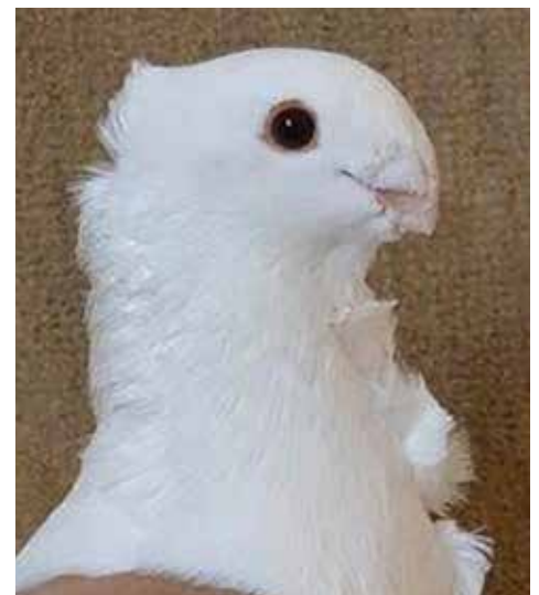
Inkeping in de manen.