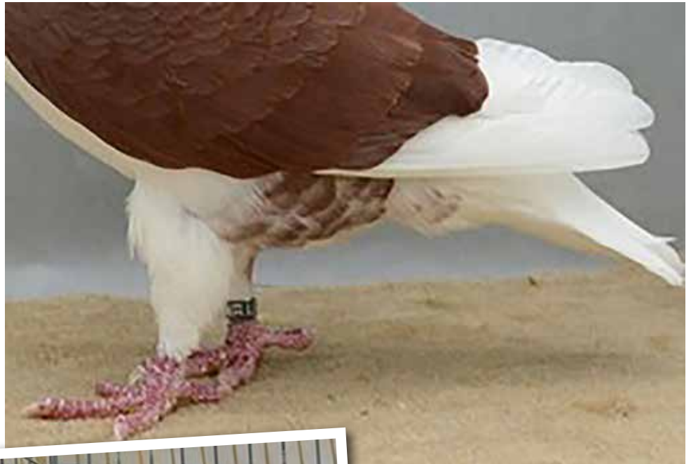
Kleur achter de benen. Dit mag.