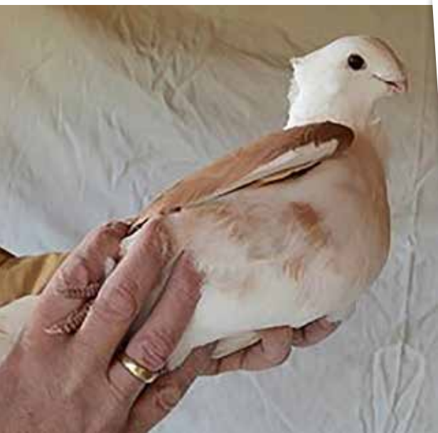
Bonte buik is ernstige fout.