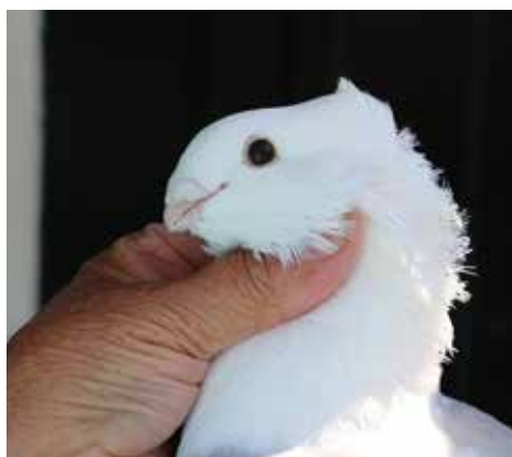
Een mooie meeuwenkop met het oplopende voorhoofd, de vlakke bovenschedel en goed oplopende puntkap.