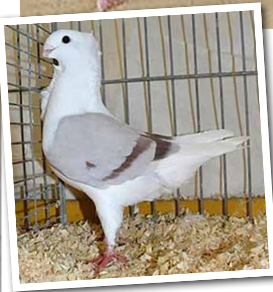
Roodzilverchild geband v.j. U97 van Ad Schelling (Deltashow 2018) bij keurmeester M. v. Uden.

slagpennen wit, de rest van de vleugel is gekleurd. Bij een perfecte kleur zijn ook alle duimveren gekleurd, maar één is een vereiste. Als de eerste veertjes komen is in het nest de tekening al vroeg waar te nemen. Er zijn vaak wel altijd kleine afwijkingen die steeds weer kunnen optreden, zoals teveel blauw achter de benen en/of soms bonte veertjes. De grondkleuren zijn over 't algemeen goed te noemen. Afwijkingen in een te dichte of open krastekening zullen er wel altijd blijven. Blauw is nog steeds de topkleur.