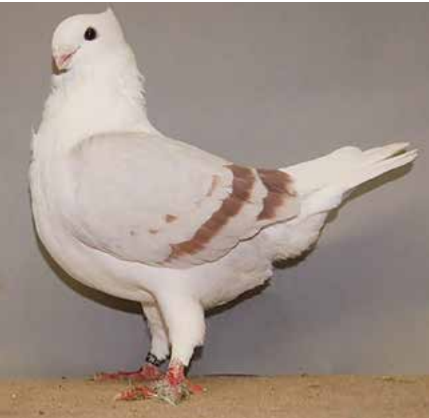
Aanleg voor een derde band.