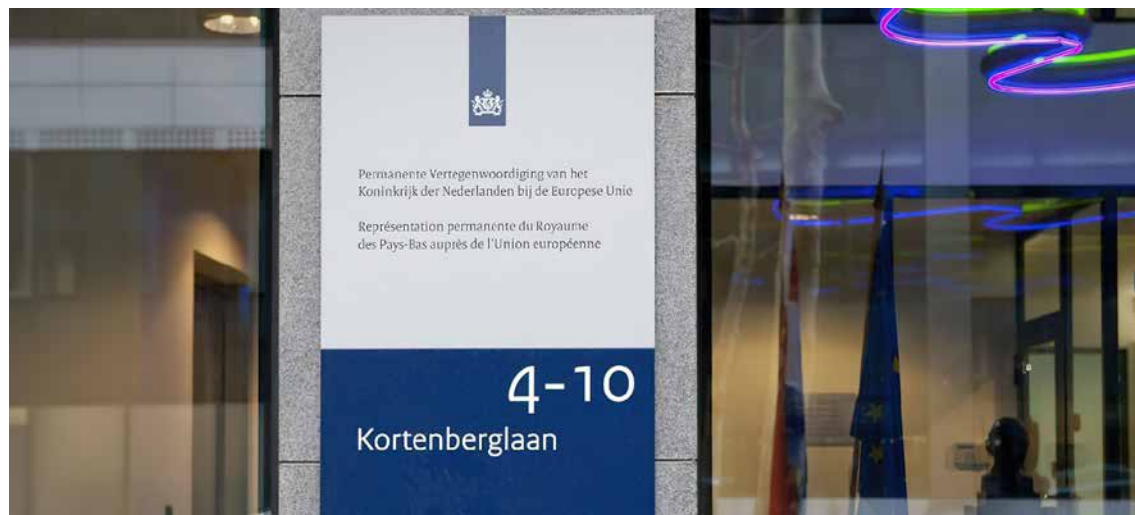
Figuur 7. De Permanente Vertegenwoordiging van het Koninkrijk der Nederlanden bij de Europese Unie aan de Avenue Cortenberg (Kortenberglaan) in Brussel.

Het budget voor al deze uitgaven maakte ooit deel uit van de Landbouwbegroting (GLB). Met de vorming van DG SANTE (toen nog DG SANCO) als zelfstandig Directoraat-Generaal, na de BSE-crisis,