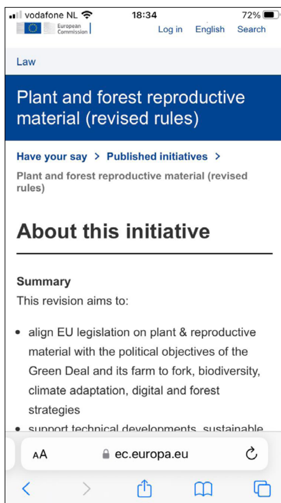
Figuur 6. Screenshot van de internetaankondiging in 2022 over de consultatie door de Europese Commissie over de nieuwe herziening van de regels voor plantaardig voortkweekingsmateriaal.

het Europees Parlement en de Raad in 2016. Daar kwam nog bij dat werkelijk alle regelgeving van DG SANTE over de voedselketen onder de Verordening viel, ook dierenwelzijn, pesticiden en aspecten van het Gemeenschappelijk landbouwbeleid (GLB), zoals beschermde oorsprongsbenamingen. Het verzet kwam dus van binnen en van buiten DG SANTE.