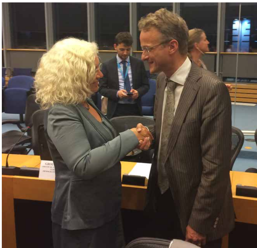
Figuur 8. Felicitaties van de rapporteur van de Europees Parlement, Karin Kadenbach (S&D / Oostenrijk) bij het bereiken van het politiek akkoord over de Controleverordening in juni 2016.

kreeg de voedselketen een zelfstandig budget. Inmiddels berust de regelgeving bij DG MARKT (Verordening 2021/690).