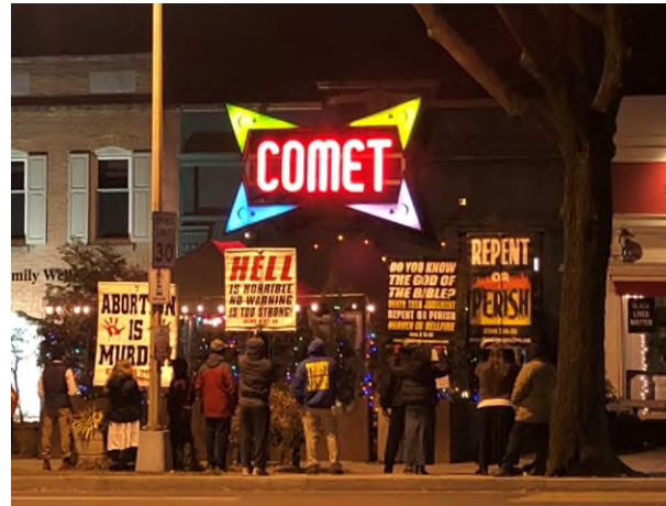
Samenzweringstheoretici verzamelen zich bij Comet Ping Pong op Trump's laatste avond in het Witte Huis

QAnon komt voort uit een eerdere samenzweringstheorie: Pizzagate, die vergelijkbare elementen bevat en in 2016 opkwam. Ook hier waren satanisme en pedofilie de centrale thema's. Democratische politici zouden zijn betrokken bij een netwerk van mensenhandel, met als centrum van hun activiteiten de pizzeria Comet Ping Pong in Washington. In de kelder van deze pizzeria zouden kinderen gevangen worden gehouden. Dit leidde tot bedreigingen aan het adres van eigenaar en personeel van het restaurant, maar bijvoorbeeld ook van bands die er weleens optreden. Het kwam zelfs tot een schietpartij door een man die de kinderen uit de kelder wilde bevrijden. Detail: de Comet Ping Pong heeft geen kelder.