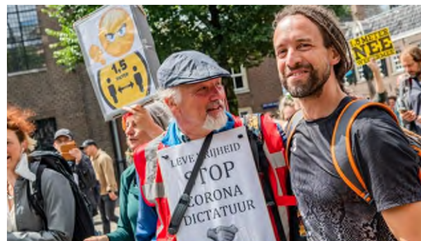
De actiegroep Viruswaanzin demonstreert tegen de coronamaatregelen

Het maskeren van het ene complot met het andere, laat ook de kwetsbare relatie tussen complot en kritiek zien. Doordat een deel van de kritiek op bijvoorbeeld regeringsbeleid voortkomt uit complotdenken, kan alle kritiek in diskrediet worden gebracht. Neem het voorbeeld van het Nederlandse coronabeleid: de voornaamste kritiek op dat beleid (in termen van aandacht) is afkomstig van Viruswaanzin/-waarheid, de club rond Willem Engel. Deze groep bedient zich royaal van complotten (zoals QAnon), organiseert protesten en roept op tot geweld. Ook wordt stelselmatig de wetenschap ter discussie gesteld, evenals de positie van het OMT en het RIVM.