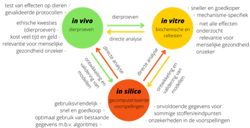
Afbeelding 1. Verschillende strategieën voor de beoordeling van toxiciteit, hun onderlinge relaties, en voordelen (+) en nadelen (-)

tonen, maar deze technieken zijn duur en tijdrovend. Als ze worden geïdentificeerd liggen de concentraties van afzonderlijke TP's en andere chemische verontreinigingen doorgaans onder gezondheidkundige grenswaarden. Aangezien de blootstelling aan TP's plaatsvindt in de vorm van mengsels met lage individuele concentraties en in principe een leven lang duurt, is het van vitaal belang dat we meer te weten komen over de identiteit en de toxicologische activiteiten van TP's. Voorspellende toxicologie kan hierbij helpen.