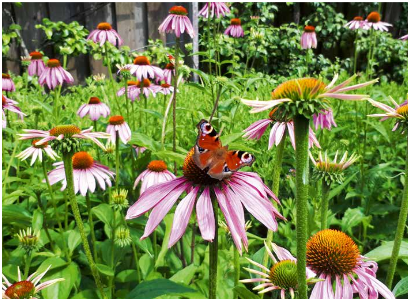
Zonnehoed met dagpauwoog.