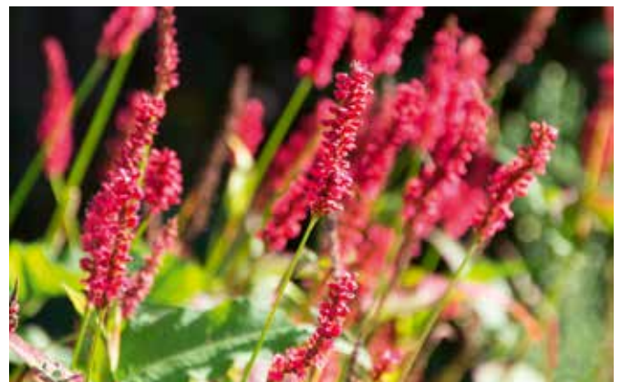
Duizendknoop / perzikkruid ( Persicaria amplexicaulis ).

De planten bestelde ik bij een klein tuincentrum waar je terecht kunt voor biologische producten en waarvan de eigenaren verstand van planten en insecten hebben. Ik bestelde de planten niet per stuk maar per m 2 omdat ik geen idee had hoeveel planten je van elke soort nodig hebt. Om te kunnen planten volgens het beplantingsplan zette ik met touw een raster van 1 bij 1 meter uit. Na een week bloeiden de aster, de duizendknoop en de goudster al voorzichtig.