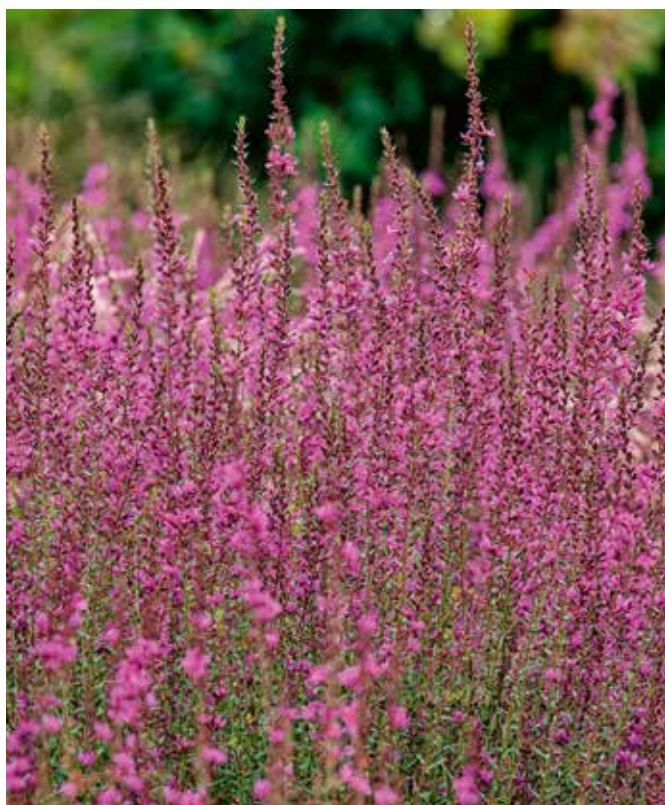
Roedekattenstaart ( Lythrum virgatum ).

genoeg ook de uitgebloeide bergamotplant. De zweefvliegen waren het meest actief op de andoorn. Het hoogtepunt van de afgelopen zomer was toch wel de merkwaardige vlucht en landing van een metaalgroene glanzende kever, de gouden tor ( Cetonia aurata ), die op de zonnehoed landde. Koolmezen, merels en mussen zijn dol op mijn tuin, ze vinden hun voedsel onder de planten en wellicht ook in hun vlucht.