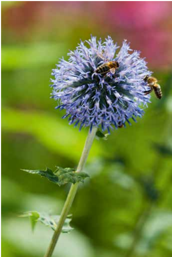
Kogeldistel met honingbijen.

Bij een tuinontwerp ga je uit van de lokale situatie. Mijn tuin is vijf meter breed en 16 meter diep met aan de twee korte kanten een klein terras en aan de lange westzijde een geplaveid pad met daarlangs een strook met keukenkruiden. Aan de lange oostzijde, waar peren- en appelboompjes tegen de schutting geleid zijn, plande ik een pad van houtsnippers. De tuin deelde ik in twee plantvakken in. Ik wilde geen ouderwets tuintje met een gazon waarlangs