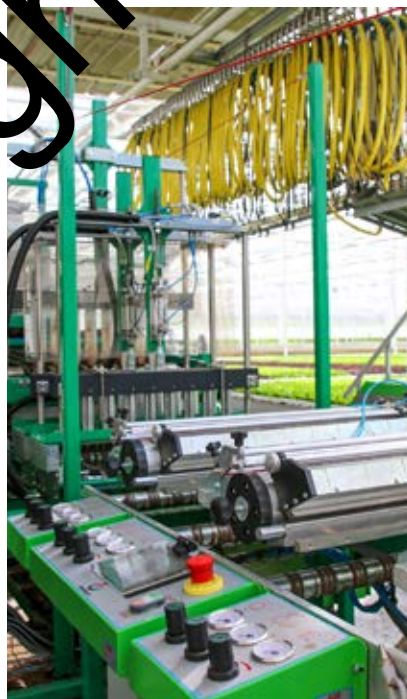
De machine is in gebruik sinds eind vorig jaar.

“Sinds het najaar van 2021 zijn we op onze nieuwe manier aan het werken. Het is anders telen en het is ook al wel ‘ns misgelopen, maar over het algemeen gaat alles zoals we hadden gehoopt. Het is wel zoeken, de kieming verloopt niet altijd even goed bijvoorbeeld en die oorzaak hebben we nog niet gevonden. Enerzijds heb je automatisatie, anderzijds is er ook teelttechniek. En die vereist toch een bepaalde finesse. Uiteindelijk hadden we vroeger ook wel eens problemen met minder plantgoed. Het is niet dat de situatie nu helemaal perfect is, maar het is wel een verbetering tegenover vroeger. Zo’n grote verbetering dat Johan binnenkort nog meer gaat zaaien. ■