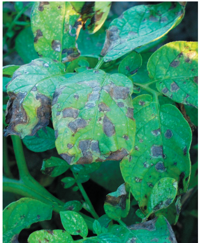
Bladschade van Alternaria in aardappel

De twee Alternaria soorten zijn in de praktijk vaak in een vroeg stadium niet te onderscheiden, pas bij het bekijken van de sporen in het laboratorium kan worden bepaald om welke stam het gaat. Omdat A. solani sterkere pathogene eigenschappen heeft dan A. alternata , is het uitgangspunt dat A. solani in aardappel de meeste schade veroorzaakt. Daarnaast worden bladvlekken niet altijd veroorzaakt door Alternaria , maar ook door Phytophthora infestans , Botrytis cinerea of nutriënten gebrek in de plant.