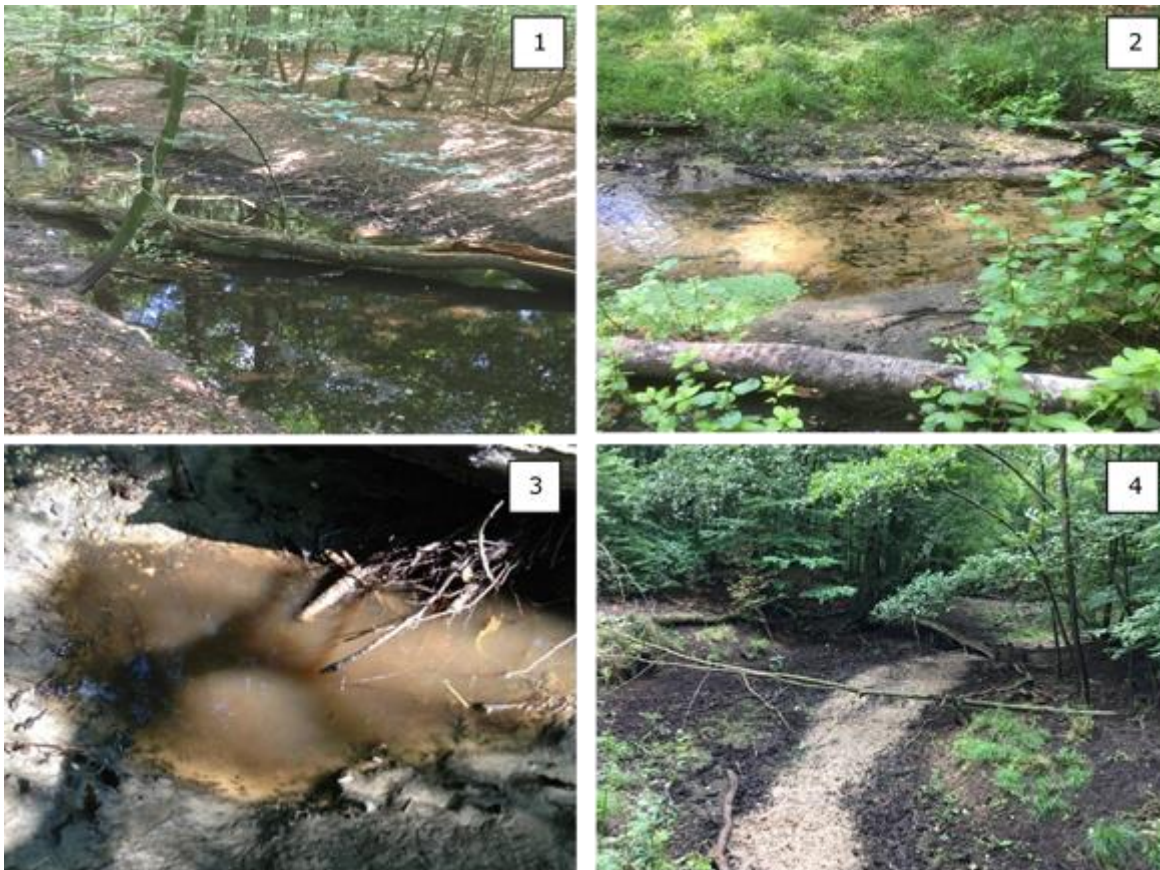
Figuur 1: Toenemende stress voor de levensgemeenschappen van laaglandbeken tijdens langdurige droogteperiodes: verlaagde afvoer en stroomsnelheid (1), afvoer zo laag dat de verbinding met de oeverzone verloren gaat (2), fragmentatie van de loop, alleen nog water in stagnante restpoelen (3) en tenslotte volledige droogval met een stofdroge bedding (4).

Of alle stappen doorlopen worden bij droogte is locatie-specifiek en wordt sterk bepaald door de lokale omstandigheden in het traject of waterlichaam. Het watertype is belangrijk, regenwatergevoede vennen in laagtes met een ondoorlatende bodem reageren immers anders op droogte dan door diep grondwater gevoede bovenlopen van beken. Ook spelen de samenstelling en de topografie van de waterbodem een belangrijke rol bij de vorming van restwateren, waarvoor diepere putten of stroomkuilen in de waterbodem aanwezig moeten zijn. Tenslotte bepaalt de hoogte van de drainagebasis of de waterbodem vochtig blijft of compleet uitdroogt.