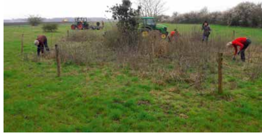
Hier wordt een overhoek gemaakt met natuurlijke begroeiing

Dit leidt tot het beter benutten van de (bodem) biodiversiteit en andere natuurlijke processen. De overhoeken zijn benut voor natuurlijke begroeiing, wat leidt tot verrijken . Het betrekken van collega-akkerbouwers lukt vooralsnog maar mondjesmaat. Steun van overheden is volgens Mulder onontbeerlijk om het initiatief verder te kunnen ontwikkelen.