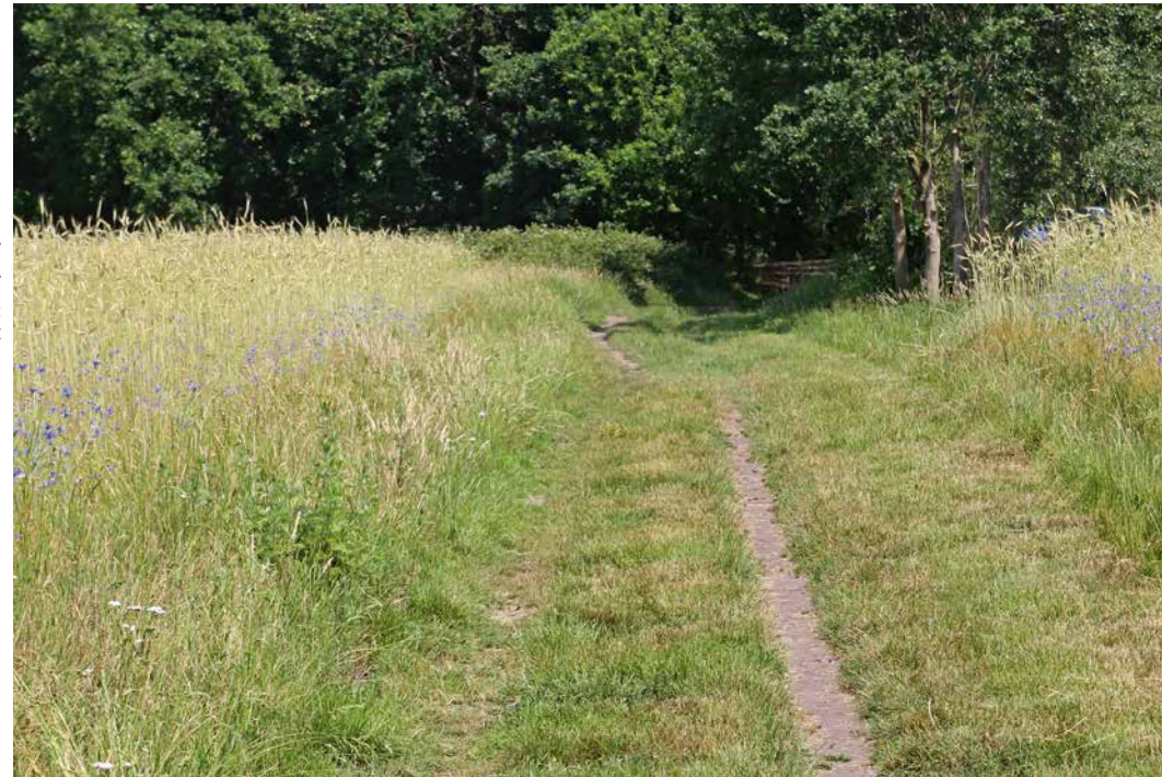
De Heideboerderij is gericht op ecosysteemherstel met een cultuurhistorisch referentiebeeld van onder meer bloemrijke roggeakkers.

graasgebieden), wat zou moeten leiden tot herstel van cultuurhistorische landschappen en bijbehorende biodiversiteit ( verrijken ), bodemverbetering ( benutten ) en het sluiten van kringlopen ( sparen ). De moeilijkheid om 'van onderop' georganiseerde projecten te laten landen bij overheden en voldoende financiering te verkrijgen, bemoeilijkt ook hier een verdere voortgang.