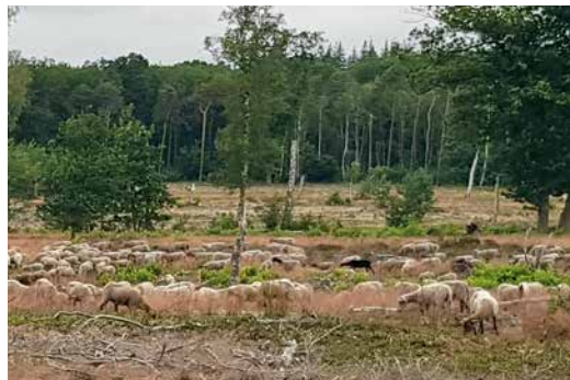
Schaapskudden zijn verbonden aan duurzame voedselproductie op zandgronden.

De Heideboerderij is gericht op ecosysteemherstel met een cultuurhistorisch referentiebeeld. Het initiatief is in 2015 ontstaan en uitgegroeid naar een platform waar schaapherders, boeren en terreinbeheerders samen met andere gebiedsondernemers en bewoners invulling geven aan duurzaam geteeld voedsel. De nadruk ligt op het verbinden van infields (akkers) en outfields (heide en