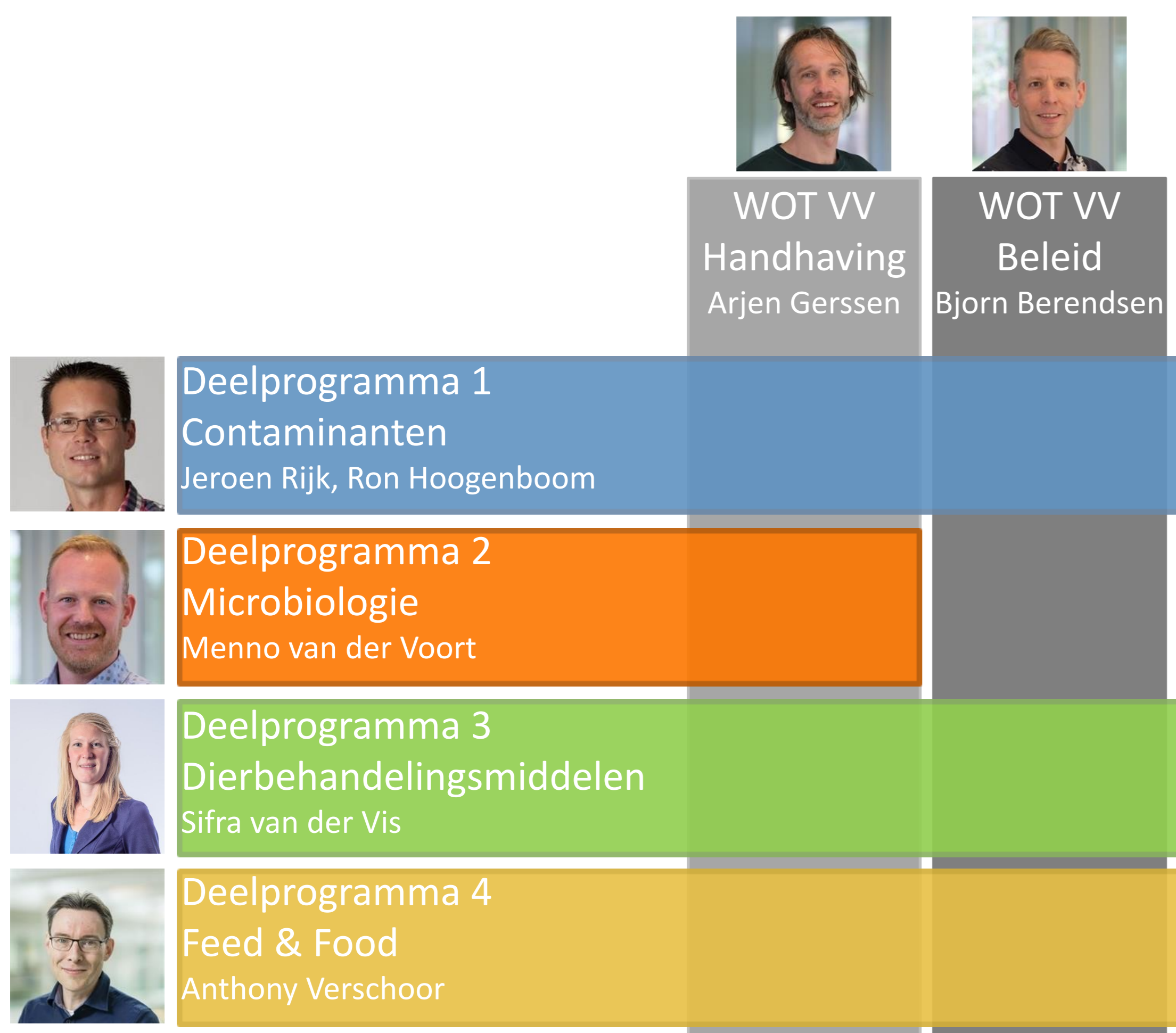
Figuur 1. Organisatiestructuur van de WOT VV Beleid en Handhaving

De Wettelijke Onderzoekstaken (WOT) van Wageningen Food Safety Research zijn opgedeeld in de Kennisbasis WOT, WOT Voedselveiligheid (WOT VV) Beleid en WOT VV Handhaving. In figuur 1 zijn de verschillende deelprogramma's weergegeven met ook de inhoudelijke aanspreekpunten.