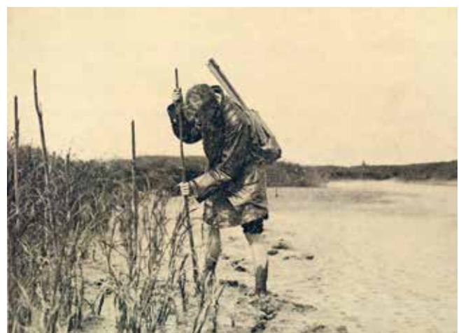
Figuur 6. Het maken van een schuilhut aan de rand van het Rietmoeras, ca. 1930.