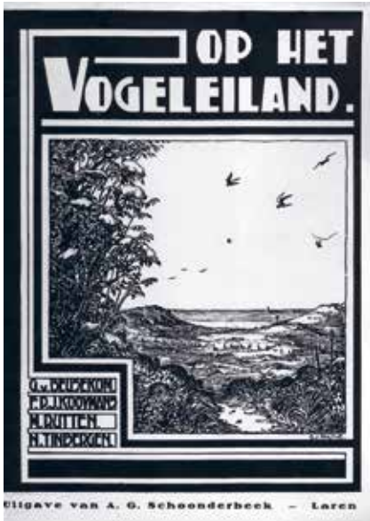
Figuur 3. Omslag boek Op het vogeleiland (op titelpagina Het vogeleiland) 1930.