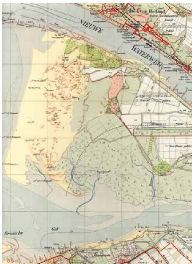
Figuur 1. Fragment topografische kaart 37 A, oorspronkelijke schaal 1 : 25.000, uitgave 1938. De naam Vogelplaat staat ten onrechte in het gors achter De Beer.

Voor een goed begrip volgt hier eerst een landschappelijke doorsnede van de Noordzee naar de Brielsche Maas. Naast de ondiepe Maasvlakte met de Robbenplaat lag een breed zandstrand dat deels begroeid was met zoutplanten (Fig. 5). Daarachter lagen lage en verwaaide, deels aangetaste duinen waar duidelijk geen beheer plaats vond en dat een zeer natuurlijke beeld vertoonde. Achter de grote zandhaak De Beer lag in een grote inham het