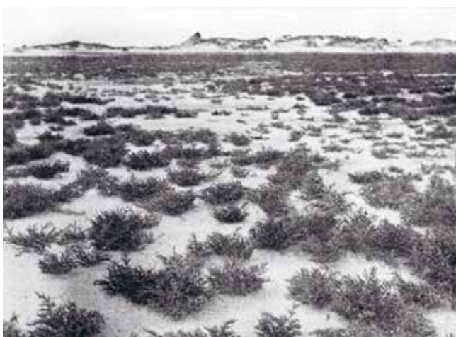
Figuur 5. Het Groene Strand met Schorrenkruid en op de achtergrond de verbrokkelde duinen, 1930.

zee waar nooit jutters kwamen. De fotografen vonden hier materiaal voor hun schuilhutten. De naam Bakengat is te vergelijken met het Sparregat in Meijendel: een paal in een duinopening. Op de topografische kaart uit 1938 staan aan de noordkant van De