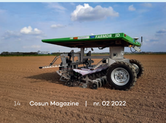
Autonome robot aan het zaaien

onkruidbestrijding worden met interesse gevolgd. Vorig jaar is in Frankrijk een autonome robot van het merk Farmdroid aan het werk gezien. Dit is een autonome zaai- en schoffelmachine. In Nederland was deze robot nog niet verkocht. Gezien de potentie van dit apparaat, werd besloten om deze aan te schaffen voor Groeikracht. Komende jaren wordt door Sensus, Cosun Beet Company en IRS in suikerbieten en cichorei ervaring met deze robot opgedaan. De robot, de Farmdroid FD20, zaait zelfstandig het perceel met RTK-gps en weet exact waar het zaadje is neergelegd. Hierdoor kan de robot zowel tussen als in de rij schoffelen, ook als het gewas nog niet of net is bovengekomen. Dit biedt mogelijkheden om de onkruiden in een vroeg stadium aan te pakken.