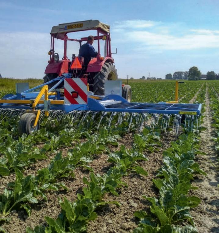
Wiedeggen in suikerbieten

meer worden geïntegreerd met mechanische inzet. Mechanische onkruidbestrijding vraagt wel om een verschuiving in denken en een andere aanpak die niet altijd eenvoudig voor handen is. Van alleen het toepassen van herbiciden gaat het immers naar een combinatie van technieken en tactieken. Extra uitdaging is er op stuifgevoelige gronden waar anti-stuifmaatregelen worden uitgevoerd, waardoor een vroegtijdige mechanische inzet lastiger is.