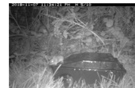
Met behulp van cameravallen is onderzocht welke niet-doelsoorten, bijvoorbeeld deze bosmuizen, de lokdozen bezoeken.

Deze aanscherping van het beleid heeft de afgelopen twee jaar voornamelijk niet geleid tot een significant verschil in blootstelling. Het percentage levermonsters met rodenticiden in de periode 1 januari 2011 - 1