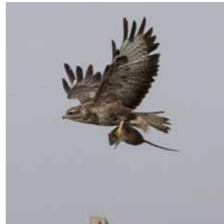
Doorvergiftiging door anticoagulante rodenticiden naar niet-doelsoorten, zoals buizerds, is nog steeds aanzienlijk.

In meer dan de helft van de onderzochte Nederlandse vogels en zoogdieren zijn anticoagulante rodenticiden aangetroffen. Dat betreft vooral knaagdiereters zoals steenmarter, steenuil, vos, bunzing, kerkuil en buizerd. Ook de vogeljagende havik en sperwer scoren hoog. Ondanks het in 2017 ingezette protocol Integraal Plaagdier Management is de doorvergiftiging met rodenticiden nog steeds groot.