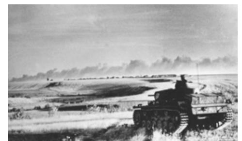
De Duitse tanks kregen te maken met een vijand uit onverwachte hoek.

De enige reserve van de Roemenen was de 1e pantserdivisie. Hoewel deze Roemeense tankbemanningen klaarstonden om te vechten en bereid waren om hierbij het leven te laten, waren hun tanks ronduit zwak. Het merendeel bestond uit licht bepantserde Tsjechische tanks, aangevuld met enkele zwaardere tanks van Duitse makelij. Onder meer de Duitse 22e pantserdivisie moest de Roemenen komen ondersteunen, maar zij hadden in totaal veel minder tanks beschikbaar dan het Rode Leger. En het grootste probleem moest nog komen.